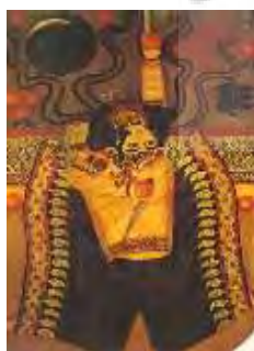
تصویر ۱۳- دختر آکروبات باز بر روی چاقو. نقاش: شیرین‌نگار. ۱۲۵۵ ه.ق. مأخذ: Falk, 1973, 43.