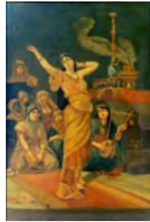
تصویر ۳- تنبیره نوبان. مجلس بزم زنان قاجار. اثر حاجی آقانقاش، ۱۳۱۳ ه.ق.