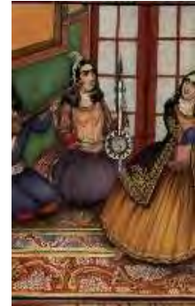
تصویر ۵- نوازنده کمانچه، بخشی از نقاشی مجلس عیش، دوره ناصرالدین شاه. مأخذ: (هزارویک شب، کاخ گلستان)

نوازندگان چپ‌دست روبه‌رو می‌شویم. در بین نوازندگانی که در حال نواختن سازهای زهی بودند، ۲ تصویر دیده شده که ساز در دست چپ نوازنده‌ها است. در حاشیه تصویر (۶)، مربوط به دوره آقامحمدخان، سمت چپ زن و مردی دیده می‌شوند. زن در حال نواختن سه‌تار با دست چپ است. در این مورد احتمال چپ‌دست بودن نوازنده زیاد است. زیرا نقاش فضای کافی برای نشان دادن او با دست راست را نیز داشته است اما او را نوازنده‌ای با دست چپ تصویر کرده است. در تصویر (۷)، سه نقاشی دیده می‌شود که، زنان ساز خود را سمت راست نگاه داشته‌اند که در این صورت نوازنده کمانچه، تنبک و دف چپ دست خواهند بود. به‌طور کلی در این سه نقاشی به نظر می‌رسد الزام ترکیب‌بندی و تبعیت هر سه نوازنده که همگی ساز را در سمت راست خود گرفته‌اند، نقاش را مجبور به تصویر کردن نوازنده‌ها به شکل چپ‌دست کرده است. نکته مهمی که شاید اشاره به آن در اینجا ضروری به نظر می‌رسد اگرچه ارتباطی با متغیر جنسیت ندارد این است که در نقاشی‌های دوران قاجار، نقاشان در ترسیم جزئیات سازها دقت چندانی نداشته‌اند. علت این قضیه می‌تواند، آگاهی نداشتن آنها از حوزه موسیقی و عدم تسلط کافی به شناخت سازها بوده باشد یا شاید هم ما را به این سو هدایت کند که نقاشی‌های دوره قاجار برای دریافت جزئیات سازهای موسیقی دست کم قابلیت استناد چندانی ندارد. در نقاشی‌های بررسی شده، در بیشتر موارد اشتراکی در جزئیات سازها اعم از تعداد گوشی، پرده و