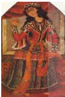
تصویر ۱۰- دختر در حال رقص با سنج. نقاش: بی‌نام. دوره فتحعلی‌شاه.

در نقاشی‌های دوره قاجار رقص زنان به وفور تصویر شده است. رقص مردان فقط در دو در نقاشی دیده شد که در بخش بالا به آن اشاره شد. در یک نقاشی نیز رقص حیوان دیده شده است. ۵ خالقی (۱۳۷۶، ۴۸۰-۴۸۳) به انواع رقص زنان در این دوره اشاره کرده و از رقص با زنگ [منظور همان رقص با سنج انگشتی]، رقص با گیلان، معلق‌زدن و رقص با شمعدان و لاله نام می‌برد. رقص زنان در نقاشی‌ها تقریباً با آنچه خالقی گفته متناسب است غیر از اینکه باید انواعی را به آن اضافه کرد. در این نقاشی‌ها گاهی رقص‌ها در همراهی سازهایی شامل تار، سه‌تار، دف و تنبک است و گاهی رقصنده‌ها به طور منفرد نشان داده شده‌اند. در این مجموعه تصاویر، شاهد هفت نوع رقص متفاوت هستیم: ۱. رقص با سنج انگشتی (تصویر ۸) که رقصنده چهار