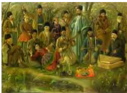
تصویر ۲- عمله طرب. اثر کمال‌الملک، ۱۳۰۳ ه.ق. مأخذ: (کاخ گلستان)