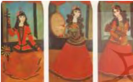
تصویر ۷- سه دختر نوازنده، نقاش: بی نام، ۱۲۶۱ ه.ق.