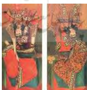
تصویر ۱۲- بخشی از نقاشی قاب آینه درب‌دار، احتمالاً اثر نجفعلی، ۱۲۷۵ ه.ق.