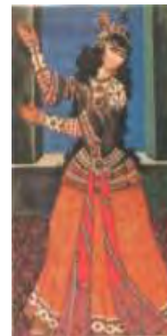
تصویر ۸- زنان رقصنده در کاسترانت‌ها، نقاش: بی‌نام. حدود ۱۲۴۰ ه.ق.