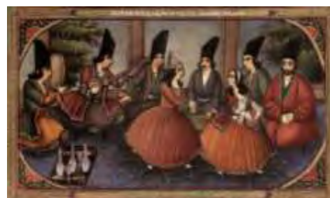
تصویر ۱- مجلس عیش برپا کرده‌اند. دوره ناصرالدین‌شاه.