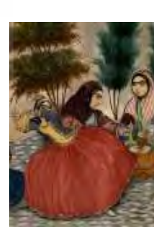
تصویر ۱۱- بخشی از نقاشی محمدعلی عود می‌زند و کنیزکان جمع‌اند، نقاش: بی‌نام، دوره ناصرالدین‌شاه.