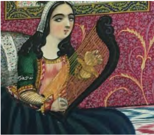
تصویر ۴- چنگ. بخشی از نقاشی قوت القلوب در نزد سیده زییده چنگ می‌زند. دوره ناصرالدین شاه.