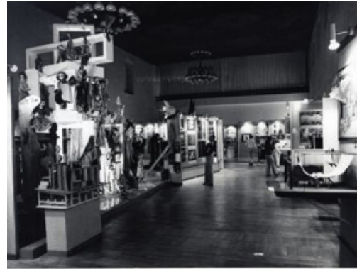
تصویر ۴- کاتالوگ رویداد پی کیو.