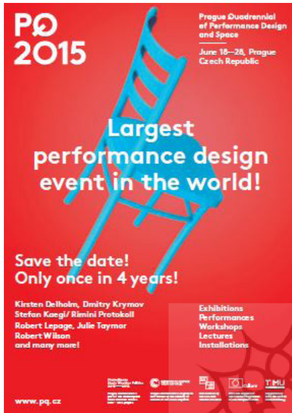
تصویر ۱۳- کاتالوگ رویداد پی کیو.