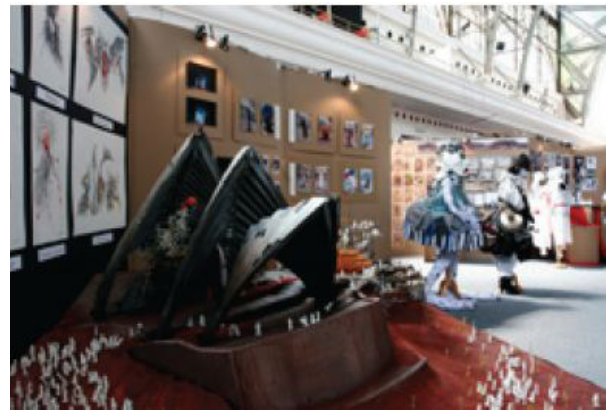
تصویر ۱۱- کاتالوگ رویداد پی کیو.