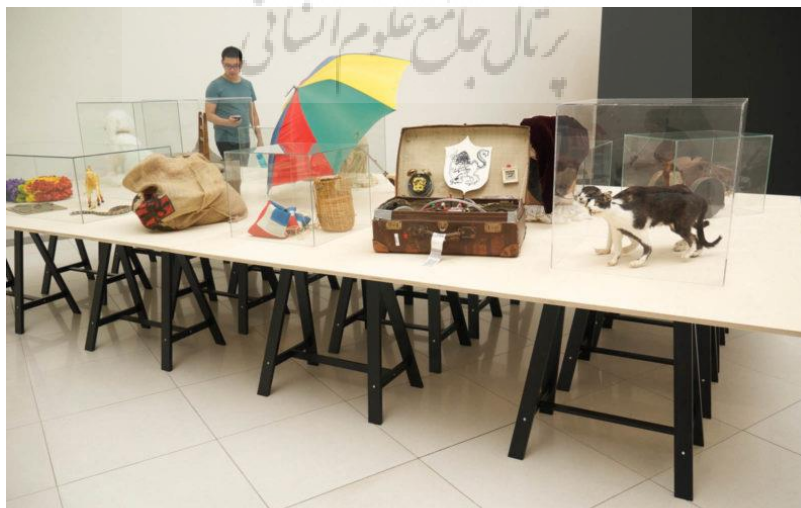
تصویر ۱۷- بخشی از رویداد پی‌کیو به عنوان آبجکت با اشیاء توسط توماس اسوبودا.