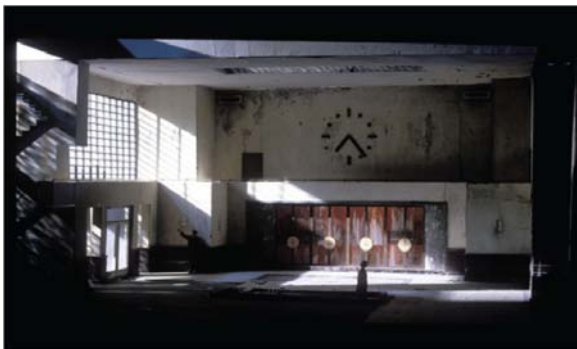
تصویر ۱۰- کاتالوگ رویداد پی کیو.