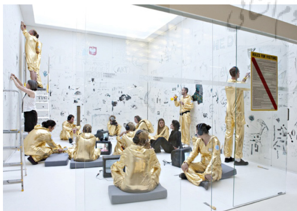
تصویر ۱۵- تصویر یکی از تجربیات مخاطب-اجراگران در "فضای مشترک".

برای اولین بار فیشرلیخت ۲۸ جریان معاصر بین هنرهای بصری و هنرهای اجرایی و تئاتر را با عنوان فضای مشترک توصیف می کند. در جایی دیگر، هانس لمان ۲۹ در تعریف آن چنین می گوید: "تئاتر به مثابه فضای مشترک بدین معنی است که فضای تئاتر برای تماشاگر و اجراگر به طور یکسان به لحاظ حواس ادراکی تجربه می شود" (Lehmann, 2006, 122). در رویکرد نوین "پی کیو" با عنوان "فضای مشترک" در سال ۲۰۱۵، طراحی صحنه به عنوان قدرت فوق العاده ای در هنرهای اجرایی، نقش های مختلفی را می تواند ایفا کند. همان گونه که در جوامع، تجربه های مشترکی همچون موسیقی یا آب و هوا و یا جریان سیاسی تأثیرگذاری غیرقابل انکاری در مردم و در ابعاد مختلف دارد. مفهوم فضای مشترک در طراحی صحنه، برای کشف تأثیر طراحی بین مخاطبین است و بیش از آن، ایجاد فضایی برای تجربه هایی چون به اشتراک گذاشتن ایده ها، داستان ها و مسائل اجتماعی و ارتباط آن با اجتماع است. در این بخش از "پی کیو"، تجربه