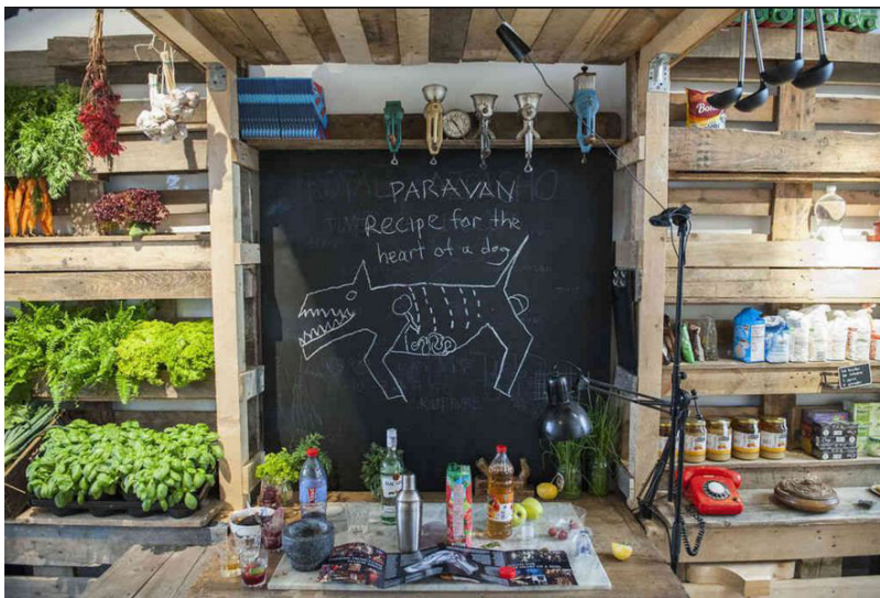
تصویر ۱۸- تصویر یکی از تجربیات بخش سازندگان در ساخت غذای طراحی شده.