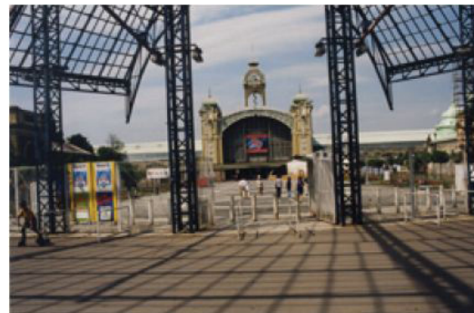
تصویر ۹- کاتالوگ رویداد پی کیو.