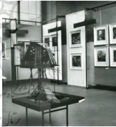
تصویر ۱- کاتالوگ رویداد پی‌کیو.

شده و هنر اینستاالیشن توسط مخاطبین " روی داد و کارگاه‌ها و سمینارهایی نیز در جوار فضاها واقعی وجود داشت. در این سال، در بخشی دیگر، نمایشگاهی از آثار رالف کولتای برگزار شد (تصویر ۹). در سال ۲۰۰۳ و دهمین چهارسالانه، تمرکز پی‌کیو بر این بود که این رویداد یک پروژه بین‌المللی نیست بلکه در پی تبیین فضایی بود که در آن ملاقات فرهنگ‌ها و فضاها رخ می‌دهد (تصویر ۱۰). در پی‌کیو ۲۰۰۷ (یازدهمین رویداد)، طراحی صحنه یا طراحی پرفورمنس به‌عنوان یک هنر مستقل زنده مطرح شد. در پی این نگرش، طراحی صحنه به مثابه اجرا به سطح خیابان‌ها کشیده شد (تصویر ۱۱). دوازدهمین رویداد پی‌کیو در سال ۲۰۱۱ به دنبال تعریف مرزهای مشترک بین هنرهای نمایشی و هنرهای بصری بود و در این سال است که از نمایشگاه بین‌المللی "طراحی صحنه و معماری تئاتر" به "رویداد چهارسالانه طراحی پرفورمنس و فضا" تبدیل می‌شود. در بخش‌های دیگر این رویداد که به‌طور غیررقابتی بودند، طراحی لباس و طراحی نور و صدا مورد توجه قرار گرفتند (تصویر ۱۲). چهارسالانه ۲۰۱۵ که سیزدهمین دوره پی‌کیو محسوب می‌شد، در فضای تاریخی شهر پراگ اتفاق افتاد و طراحی صحنه از مکان صحنه تئاتر به مکانی دیگر یعنی فضای زندگی شهری کشیده شد