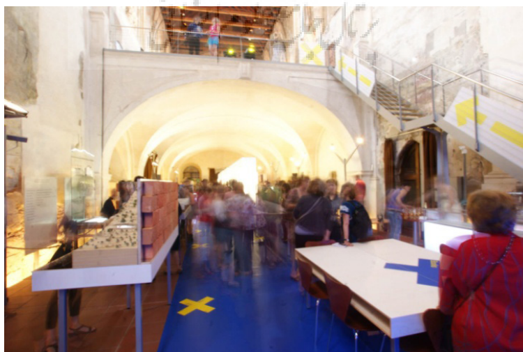
تصویر ۱۶- تصویر یکی از تجربیات مخاطبان در فضای معماری ناپایدار.