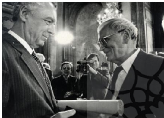
تصویر ۶- کاتالوگ رویداد پی کیو.