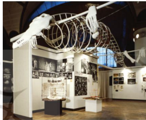
تصویر ۵-۲- کاتالوگ رویداد پی کیو. ماخذ: ( http://services.pq.cz/en/archive.html )