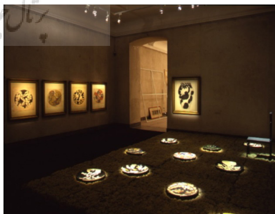
تصویر ۱۴- تصویری از اتاق های اینستالیشن "آنا آن شب به خانه باز نگشت" به کارگردانی و طراحی رابرت ویلسون.

در دهه سال ۱۹۶۰، شاهد تلفیق جریان های مختلف از هنرهای تجسمی به خصوص نقاشی و مجسمه سازی بودیم. هم زمان موسیقی تجربی و تئاتر آوانگارد و بسیاری از زمینه های دیگر از طریق رسانه های الکترونیکی و فن آوری های جدید توسعه یافتند. بسیاری از این تلفیق ها و مشارکت ها، بر حضور فیزیکی و رویداد و واکنش در برابر مرزهای تثبیت شده میان هنر و زندگی به عنوان یک واکنش در برابر دیدگاه های سنتی در مورد تئاتر و هنر بود (Ring Petersen, 2015, 239). صرف نظر از مباحثی که در هنر اینستالیشن و مرزهای آن با هنرهای اجرایی مطرح است، چه به لحاظ تاریخی یعنی از اوایل سال ۱۹۶۰ (زمان رویش هنر اینستالیشن) و چه به لحاظ تعاریف و رویکرد، همپوشانی فراوانی با طراحی صحنه از نوع ارائه شده در