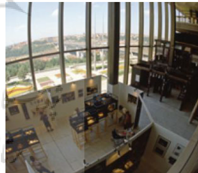
تصویر ۷- کاتالوگ رویداد پی کیو. ماخذ: ( http://services.pq.cz/en/archive.html )