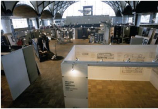
تصویر ۵-۱- کاتالوگ رویداد پی کیو.