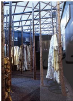
تصویر ۸- کاتالوگ رویداد پی کیو.