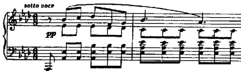
تصویر ۳- پرلود اپوس ۲۸ شوپن در لابل مل مازور.

شوپن کاربرد صحیح پدال را منوط به دقت مداوم در شنیدن صوت حاصل از کاربرد آن در تمام طول عمر حرفه‌ای یک نوازنده می‌دانسته و معتقد بوده شاگردانش باید همواره نسبت به کاربرد پدال مطالعه و دقت داشته باشند. وی علی‌رغم استفاده از پدال‌های بسیار طولانی و عوض کردن‌های سریع، به افکت‌های صوتی زیادی دست می‌یافت. از جمله رنگ آمیزی‌های صوتی نوین و کاربرد پدال در ملودی‌های نجواگونه‌ی او تحسین برانگیز بوده است. وی به دلیل نیاز به لمس سبک کلایه‌ها، پیانوهای پلبل ۲۱ را ترجیح می‌داده است. صدای این پیانوهای مخملی و لمس کلایه‌ها بسیار ظریف و سبک است. ضمن این که کاربرد پدال آن، چنان حساس بوده که برای استفاده در پاساژهای کروماتیک