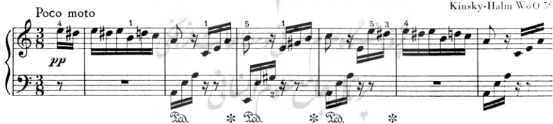
تصویر ۱- برای البزه.

علائم زیادی در نسخه‌های این اثر برای دینامیک به کار نرفته اما درباره‌ی پدال‌گیری با دقت قابل توجهی اشاراتی وجود دارد. برخلاف تصور بسیاری از بیانیه‌ها، این پدال‌گیری را نمی‌توان در زمره‌ی پدال‌گیری لگاتو قرار داد. زیرا پدال‌گیری لگاتو اولین بار در