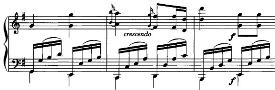
تصویر ۲- سناتر مازور موتسارت K311 - موومان دوم.