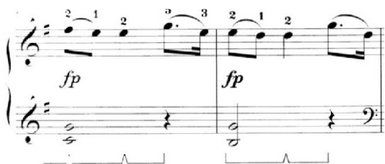
تصویر ۴ - سنات K332 موتسارت، موومان اول.

هسکل به کاربرد و عدم کاربرد پدال برای برجسته‌سازی ضرب‌ها اشاره می‌کند (Haskell, 2009, 7). برای این منظور، فینال سنات می‌مینور هایدن را مثال می‌زند که علائم کاربرد پدال ریتمیک روی هر ضرب در برخی ویرایش‌های موجود گذاشته شده است. با این حال وی کاربرد پدال در ضرب‌های دوم را پیشنهاد نمی‌کند زیرا این کار تأکید اضافی روی ضرب ضعیف قرار می‌دهد (Brown, 1999, 26). همچنین در سنات K283 موتسارت در موومان اول