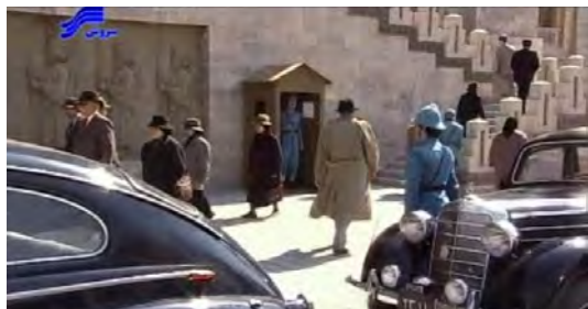
تصویر ۷. نمایی از محوطه‌ی مقابل ورودی اصلی ساختمان شهربانی

انتخاب دو لوکیشن داخلی و خارجی مجزا و ظاهراً بدون ارتباط با یکدیگر برای ساختمان شهربانی، اندیشه‌ی تعامل پلان و نما در ذهن طراح صحنه توانسته است انتخاب‌های درست و هماهنگی را برای وی به همراه بیاورد.