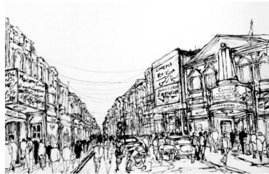
تصویر ۱. نمایی از خیابان لاله‌زار قدیم، اسکیس از خسرو خورشیدی، ۱۳۹۱

مدار صفر درجه، از صحنه‌های داخلی متعدد برخوردار است، به‌طوری که در نهایت و با ارزیابی دقیق می‌توان بیست‌وهفت صحنه داخلی را در این مجموعه شناسایی کرد. با این حال در این ارزیابی، هفت صحنه - به‌عنوان اصلی‌ترین لوکیشن‌های داخلی - بررسی می‌شود.