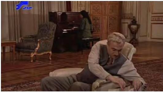
تصویر ۳. سالن پذیرایی خانه زینت‌الملوک

از سوی دیگر در دوران پهلوی اول، استفاده از آجر در بنا به‌علت سرعت و سهولت در اجرا، رواج بیشتری یافت. ضمن آنکه رویکردی به عناصر حجمی و مجسمه‌سازی با نگاهی دوگانه به دوران باستان و مؤلفه‌های غربی به‌شکل مجسمه‌ها در میدان‌ها و اماکن اداری و عمومی به‌وجود آمد. این رویکرد جدید را می‌توان در ساختمان‌های کاخ دادگستری، ساختمان شهربانی، (باغ ملی) و ... به‌شکلی کاملاً محسوس مشاهده کرد. آنچه مسلم است، مدرنیسم التقاطی‌ای که خانواده زینت‌الملوک در این مجموعه از آن برخوردارند، به فضا‌سازی و معماری نیز راه می‌یابد و عمارتی را به‌وجود می‌آورد که ترکیبی از همین نگاه شرقی و معماری غربی را شامل می‌شود. «در دوران پهلوی اول، هنرمندان معماری ایرانی و غربی که سازنده بناهای دولتی و آموزشی و صنعتی بودند، برای اولین بار با نوعی انتخاب تاریخی روبه‌رو شدند. آنان باید می‌فهمیدند که از چه دوره چگونه و به چه مقدار انتخاب کنند» (صارمی و رادمرد، ۱۳۷۶: ۱۴۵).