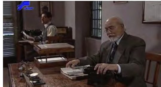
تصویر ۵. دفتر روزنامه حبیب

گذاشته می‌شود، ساختمانی است که دیوارهای داخلی آن خاکستری بوده و کف داخل آن نیز از موزاییک پوشانده شده است. در و پنجره‌های آن از چوب قهوه‌ای است و پنجره‌ها به‌صورت مشبک‌های بسیار ریز که مانع دید از بیرون می‌شود، ساخته شده است (تصویر ۵).