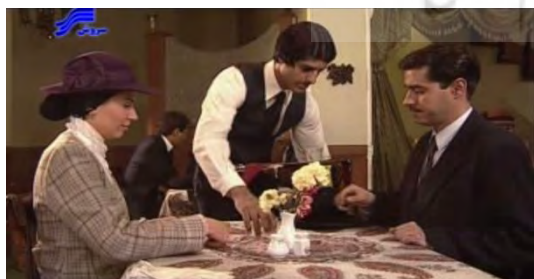
تصویر ۸. سالن اصلی گرند هتل

یکی از لوکیشن‌هایی که چندین بار در این مجموعه با زوایای مختلف به نمایش درآمده است، کافه رستوران گرند هتل - بازسازی‌شده‌ی آن در مجموعه‌ی "شهرک سینمایی غزالی" - است. این کافه که در واقع جزئی از مجموعه‌ی زیبا و باارزش خیابان لاله‌زار بوده است، تمامی ویژگی‌های خاص این خیابان را در خود جمع کرده است و به نمایش می‌گذارد (تصویر ۸).