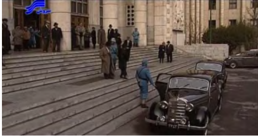
تصویر ۶. نمایی از مقابل ورودی اصلی کاخ دادگستری

عمدتاً آلمانی بودند- تغییرات، تزیینات و موتیف‌های سنتی ایرانی نیز به آن اضافه شد (تصویر ۶).