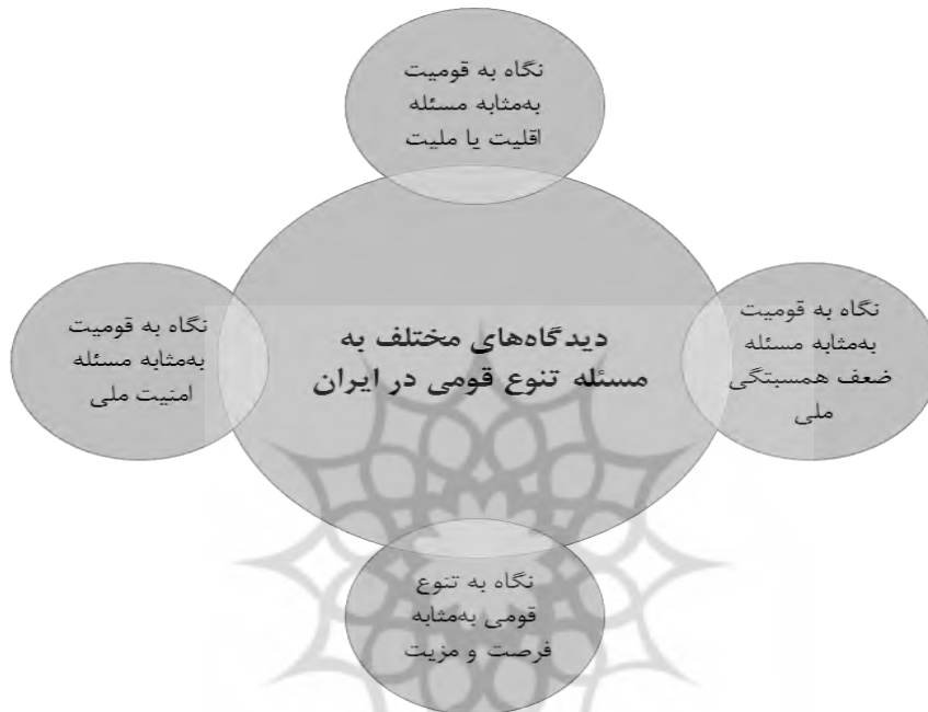
شکل شماره ۱. دیدگاه‌های چهارگانه به مسئله تنوع قومی در ایران

رویکرد مزبور می‌باشد. با توجه به مسائل ذکرشده در بالا، سعی می‌شود تعریف مشخصی از سه کلیدواژه اصلی پژوهش در ابتدای امر طرح شود.