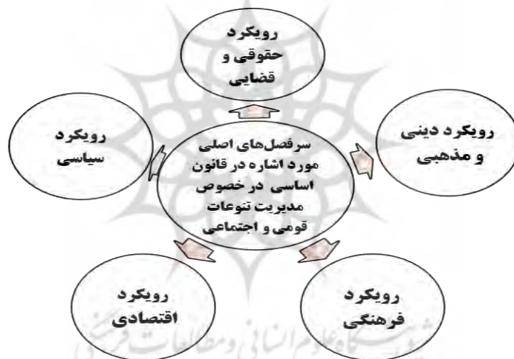
شکل شماره ۲. دسته‌بندی مفاهیم مستفاد از قانون اساسی ناظر به مدیریت تنوعات قومی و اجتماعی

در این بخش پنج رویکرد حقوقی، سیاسی، دینی و مذهبی، فرهنگی و اقتصادی قانون اساسی نسبت به مدیریت تنوعات قومی و اجتماعی در ایران استخراج شده است. از آنجا که متصدیان مدیریت تنوعات قومی و اجتماعی در جمهوری اسلامی ایران نهادهای گوناگون دولتی و حاکمیتی با کارکردهای مختلف هستند، این سبک دسته‌بندی نیز بستر مناسب را برای یک الگوی عملیاتی و اجرایی کارآمد رهنمون می‌سازد، زیرا در نظام جمهوری اسلامی نهادهای متعددی به صورت مستقیم و غیرمستقیم در فرایند مدیریت تنوعات قومی مؤثر هستند و این دسته‌بندی در الگوی کلی مستفاد، جایگاه و کارکردهای هر یک از دستگاه‌ها را مشخص خواهد کرد و مانع هرگونه پراکنده‌گویی و کلی‌گویی خواهد شد.