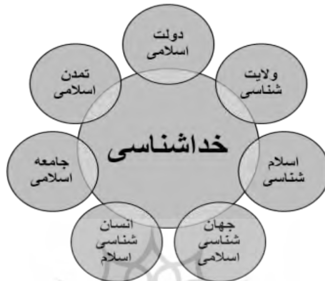
شکل شماره ۲. مولفه‌های موثر در کنش و تفکر انسان (یافته‌های نگارنده)