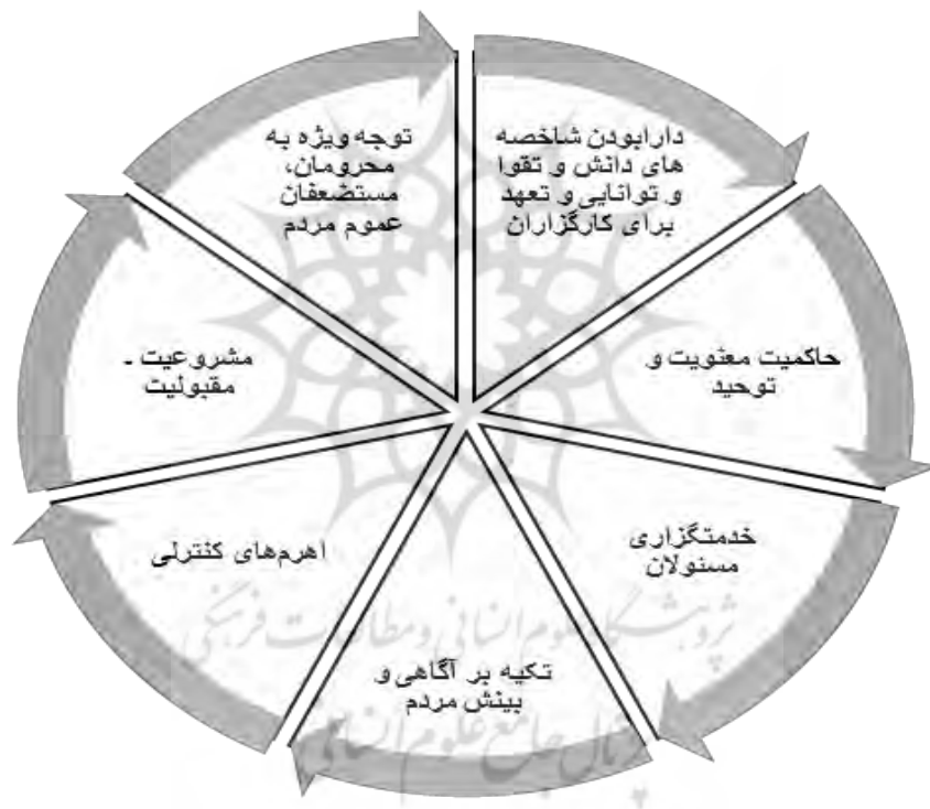
شکل شماره ۳. ویژگی‌ها، مبانی و منابع الگوی حکومتی مردم‌سالاری دینی (حسینی خامنه‌ای، ۱۳۸۲: ۱۸ - ۲۳)

پس مردمی و اسلامی بودن، خیمه و ستون اصلی حکومت و نظام سیاسی جمهوری اسلامی ایران است که هرکدام بدون دیگری امکان وجود ندارند. (مرکز مدارک فرهنگی انقلاب اسلامی، ۱۳۶۹، ج ۷: ۳) ویژگی‌ها، مبانی و منابع متمایزبخش الگوی حکومتی مردم‌سالاری دینی با سایر الگوهای حکمرانی غرب در اندیشه‌های مقام معظم رهبری در شکل شماره سوم آورده شده است.