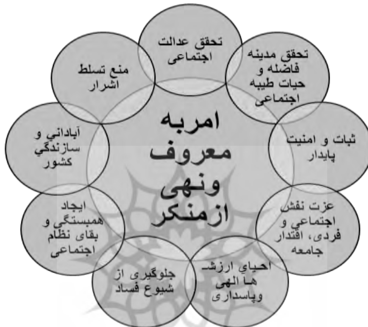
شکل شماره ۴. فواید امر به معروف و نهی از منکر در نظام اسلامی (خطیبی کوشک، ۱۳۸۷: ۱۴۳-۱۴۹)

اغلب فقهای شیعه نیز بر فریضه عقلی و نقلی امر به معروف و نهی از منکر در نظام سیاسی اسلامی تأکید کردند و از آن به عنوان فرآیند انضباط اجتماعی نام می‌برند؛ از این رو کارویژه‌های مختلفی برای آن در سطح جامعه برشمرده‌اند.