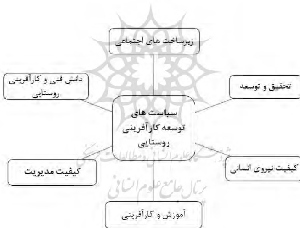
شکل (۳)- سیاست‌های توسعه کارآفرینی روستایی، (رکن‌الدین افتخاری و سجاسی قیداری، ۱۳۸۹)

رکن‌الدین افتخاری و سجاسی قیداری (۱۳۸۹) در مطالعه خود عوامل مهمی که در فرآیند توسعه کارآفرینی روستایی تسریع بخشیده و توسعه می‌دهند، را معرفی نموده‌اند که به‌طور خلاصه در شکل (۳) نشان داده شده است.