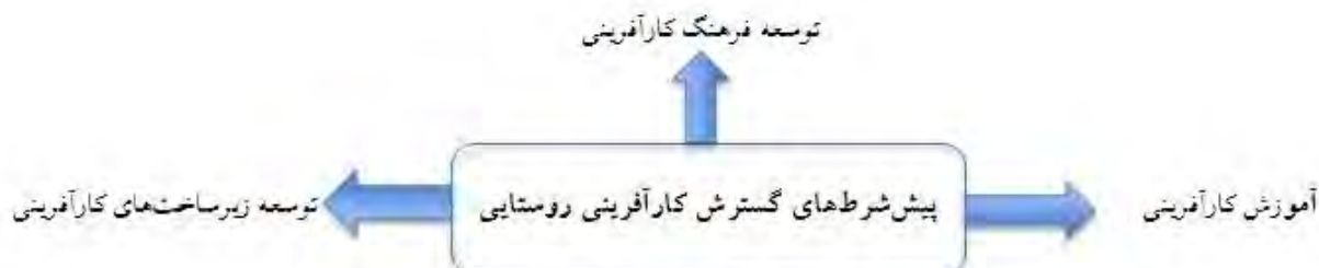
شکل (۲) - پیش‌شرط‌های گسترش کارآفرینی روستایی (خسروی پور و همکاران، ۱۳۹۵)