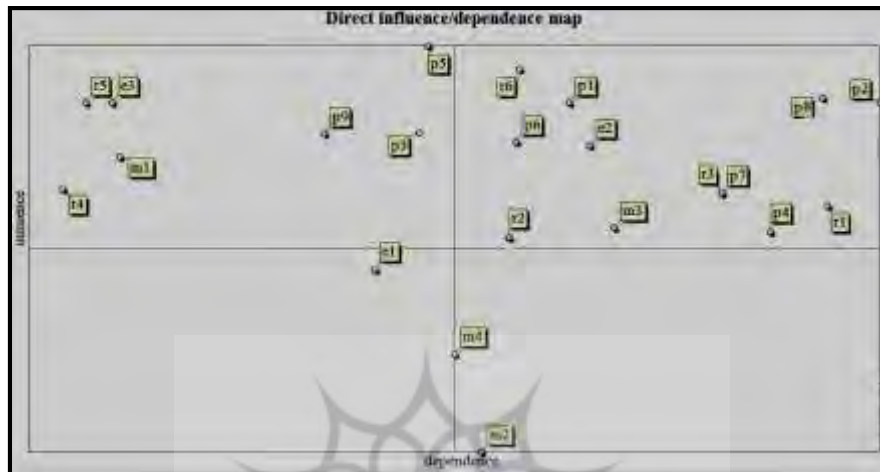
شکل ۱. نمودار تأثیرگذاری و تأثیرپذیری مستقیم شاخص‌های مدیریت تداوم کسب و کار خود اشتغالی زنان سرپرست خانوار در شهرستان چرداول.

مدیریت کسب و کار به افراد خبره‌تر «e3»، «شکل‌گیری هم‌افزایی‌های هدفمندتر r4»، «بهره‌گیری از نوآوری‌های جدید منطبق بر شرایط r3»، «نیروهای خانوادگی حمایت‌کننده موجود p7»، و «تنوع یا شوک تولیدی m1» که در موازات خط قطری قرار دارند به عنوان متغیرهای ریسک شناسایی شده و پتانسیل بالایی برای تبدیل شدن به بازیگران اصلی در سیستم مذکور دارند. این متغیرها با توجه به ویژگی ناپایدار خود، یک نقطه انفصال بالقوه برای سیستم محسوب می‌شوند. سایر متغیرهای