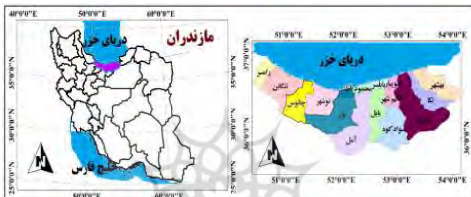
شکل ۱. موقعیت منطقه مورد مطالعه

تهران و سمنان واقع شده‌اند. مساحت استان حدود ۲۴۰۹۱/۳ کیلومتر مربع است و در حدود ۱/۴۶ درصد مساحت کل کشور را تشکیل می‌دهد. براساس آخرین سرشماری جمعیتی در سال ۱۳۸۵، استان مازندران ۲۹۲۲۴۳۲ نفر جمعیت داشته که ۱۵۵۴۱۴۳ نفر آن در نقاط شهری و ۱۳۶۸۲۳۳ نفر در نقاط روستایی ساکن بوده‌اند (سایت فرمانداری مازندران).