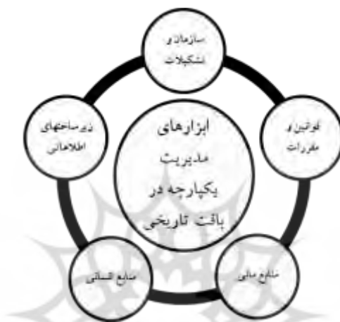
شکل ۱. مدل نظری و تحلیلی پژوهش

نیست) و این ساختارها متناسب با نیازها، اهداف و ویژگی‌هایشان سازمان را تشکیل می‌دهند؛ یعنی سازمان متناسب با ساختار و ساختار متناسب با نهاد است. روابط عملکردی درون‌سازمانی و برون‌سازمانی می‌تواند متضمن تفرق یا یکپارچگی مدیریت شهری باشد (کاظمیان، ۱۳۸۹، ص. ۲۹).