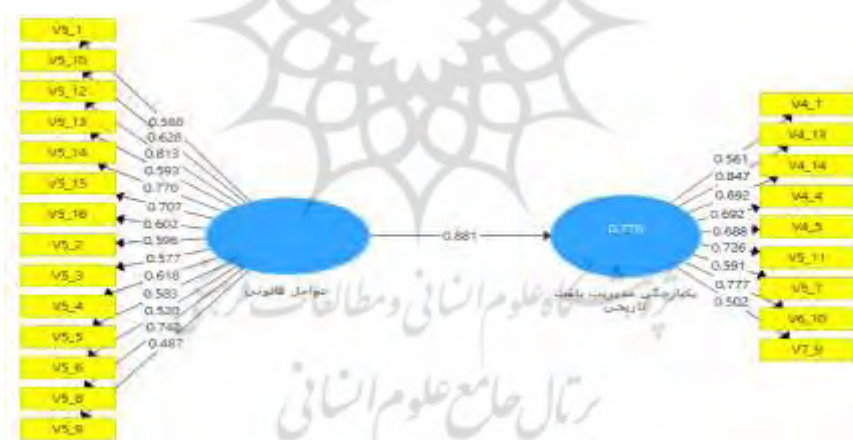
شکل ۳. مدل معادله ساختاری اثر عوامل قانونی بر یکپارچگی مدیریت بافت تاریخی