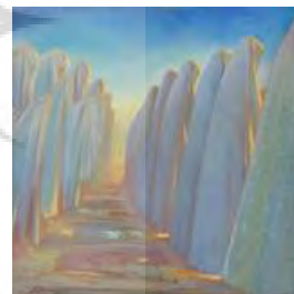
تصویر ۱۴. نماز، کاظم چلیپا، تاریخ اثر: ۱۳۷۳، تکنیک: رنگ و روغن، قطع اثر: ۱۲۰ در ۱۲۰.