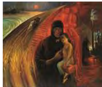
تصویر ۱۷. مقاومت، کاظم چلیپا، تاریخ اثر: ۱۳۶۲، تکنیک: رنگ و روغن، قطع اثر: ۱۲۰ در ۱۰۰.