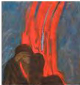
تصویر ۱۸. رحلت امام، کاظم چلیپا، تاریخ اثر: ۱۳۶۸، تکنیک: رنگ پلاستیک، قطع اثر: ۱۰۰ در ۷۰.