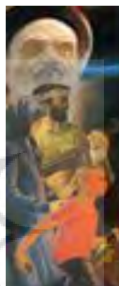
تصویر ۷. جنگاوران جبهه نور، کاظم چلیپا، تاریخ اثر: تصویر ۸. ریشه در عشق، کاظم چلیپا، تاریخ اثر: ۱۳۵۹، تکنیک: رنگ روغن، قطع اثر: ۲۰۰ در ۷۰. ۱۳۶۵، تکنیک: ترکیب مواد، قطع اثر: ۲۰۰ در ۸۰.

در اثر «مهاجرین» (تصویر ۹) از این هنرمند شاهد حضور یک زن روستایی هستیم که نقاش جهت به تصویر کشیدن آن در فضای بومی و مرتبط با منطقه زندگی و پوشش او، علاوه بر ذهنیت، سبک و گرایش خاص خویش، به یک‌سری از فضاها، عناصر، المان‌های بومی و جنبه‌های واقعی زندگی این زنان زحمت‌کش که همیشه و خصوصاً در دوران انقلاب اسلامی بیشترین بار زندگی بر دوش آنان بوده توجه کرده و کمتر قصد را بر القای بعد مفهومی این سوژه (زن) داشته است.