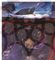
تصویر ۱۵. موش‌های سکه‌خوار، کاظم چلیپا تاریخ اثر: ۱۳۶۳، تکنیک: رنگ و روغن، قطع اثر: ۲۰۰ در ۲۵۰.