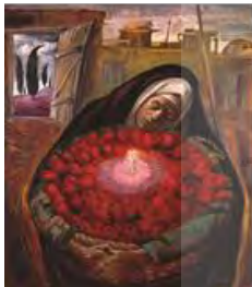
تصویر ۱۶. کویر، تاریخ اثر: ۱۳۶۳، تکنیک: رنگ و روغن، قطع اثر: ۱۶۰ در ۱۳۰.

با توجه به این که نقاشی دوران انقلاب اسلامی علاوه بر واقع‌گرایی دارای جنبه‌هایی ماورائی، نمادین و عاطفی نیز بوده است، در آثاری از این هنرمند با محتوای زن، بیشتر شاهد بهره‌گیری از جنبه‌های نمادین با رویکردهای عاطفی ۱ هستیم. استفاده از این رویکرد را در آثار دوران انقلاب چلیپا می‌توان دید که منجر به نمایش بخشی از هویت ملی زن در آثارش شده است.