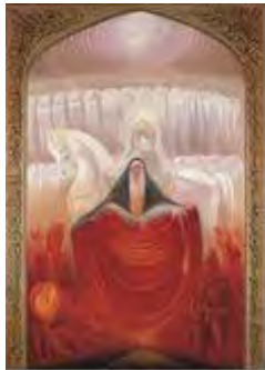
تصویر ۱۳. اینار، کاظم چلیپا، تاریخ اثر: ۱۳۶۰، تکنیک: رنگ و روغن، قطع اثر: ۲۰۰ در ۳۰۰.