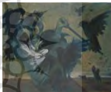
تصویر ۱۰. هجوم، کاظم چلیپا، تاریخ اثر: ۱۳۶۵،

تکنیک: رنگ و روغن، قطع اثر: ۱۰۰ در ۷۰، ۱۳۶۴، تکنیک: رنگ و روغن، قطع اثر ۲۰۰ در ۱۸۰.