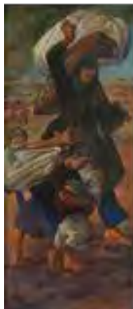
تصویر ۹. مهاجرت، کاظم چلیپا، تاریخ اثر: ۱۳۶۵، تکنیک: رنگ و روغن، قطع اثر: ۱۸۰ در ۸۰