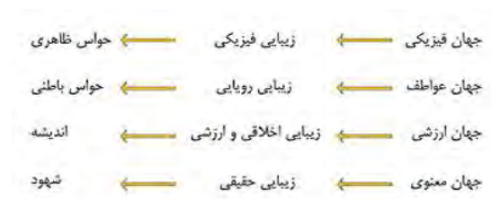
شکل ۳. رابطه «جهان معنا»، نمود هنری و ادراک مخاطب (طاهباز، ۱۳۸۲)