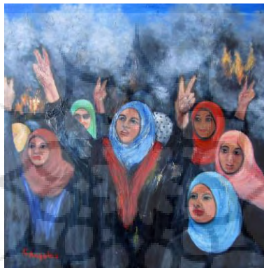
شکل ۸. صدای امید اثر سینتیا آنجل ۱ (Alejandra Pareja, 2017)