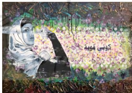
شکل ۹. نقاشی مشهور عمان الحاجری با عنوان «ما قوی می‌مانیم» ۲ که بر با زبان هنر، بر نقش زنان محبّه عربی در نهضت بیداری اسلامی و نقش کلیدی آن‌ها در مبارزه با خفقان رژیم آل خلیفه تأکید دارد.