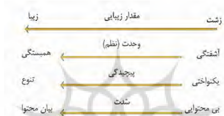
شکل ۴. چارچوب مفاهیم دوگانه سنجش محتوا بر اساس انواع آن و ابزار ادراک انسان (طاهباز، ۱۳۸۲)

فرضیه خنثی یا فرضیه صفر: برداشت مخاطب عام و مخاطب خاص از مفهوم زیبایی اثر هنری یکسان است و تفاوتی میان برداشت این دو گروه وجود ندارد. در مقاله حاضر هرچند محور اصلی سخن «مخاطب» و تعامل هنرمند و مخاطب است، اما بستر سخن «زیبایی» است. وقتی از کیفیت و چگونگی تأثیر اثر هنری بر مخاطب سخن می‌گوییم، در واقع در جست‌وجوی آنیم که قوانین حاکم بر این احساس را کشف کنیم. چه می‌شود که پدیده‌ای در نظر ما زیبا و پدیده‌ای دیگر زشت جلوه‌گر می‌شود؟ (طاهباز، ۱۳۸۲) به عبارت دیگر، دو مقوله تأثیر اثر هنری بر مخاطب و زیبایی، رابطه‌ای نزدیک و تنگاتنگ دارند (شکل ۴).