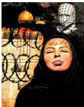
شکل ۱۰. نقاشی عمان الحاجری با عنوان «ما ایستاده ایم» ۱ در دفاع از مقاومت مردم مظلوم فلسطین