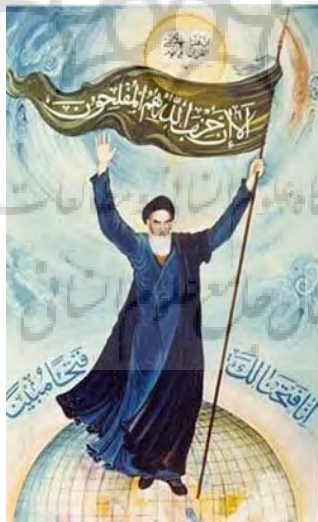
شکل ۱. استفاده از نمادها و نشان‌های قابل‌درک برای تمام مردم با هدف به تصویرکشیدن ارزش‌های بومی و تجلی هویت اسلامی - ایرانی در هنر به نقل از: ( http://www.tebyan.net ).

نظریه‌هایی است که نمی‌تواند به‌صورت کامل با دیدگاه هنر خدامحور یعنی هنر دینی و توحیدی، هماهنگ معرفی شود و نیاز به بازنگری و تأمل مجدد دارد. هنرمند اخلاق‌مدار، پیش از هر اقدامی، باید به شناخت و درک راستین سوژه بپردازد. بر اساس نقش «هرمنوتیک»، استناد به «نیت مؤلف» یا «قصد هنرمند» از راه‌های شناخت معنا و تفسیر یک اثر در نقد ادبی و هنری است (محتشم، ۱۳۹۵). در مطالعات هنر دینی در اندیشه‌های مسیحی نیز نسبت به هنر بی‌اعتنا به جامعه، رویکردی منفی وجود داشته است. آگوستین، نخستین متفکر سنت مسیحی است که توجه‌ای ویژه به هنر و زیبایی‌شناسی نشان داد و به تدوین نظامی جامع در این حوزه اقدام کرد که بعدها تأثیر شگرفی بر اندیشمندان پس از خود، به‌ویژه در قرون وسطی گذاشت. اهتمام ویژه او به هنر و زیبایی، در کنار وفاداری کاملش به آموزه‌های مسیحی، که نمود کامل آن در کتاب شهر خدا و دفاع از کیان مسیحیت و تقسیم انسان‌ها براساس باورهایشان ، به حضور در شهر خدا و شهر زمین تیلور یافت ، این مسئله را پیش‌روی محقق قرار می‌دهد که آگوستین چه جایگاهی برای هنرمند در کتاب شهر خدای خود داشت (رازی زاده، ۱۳۹۷). سنت آگوستین به‌عنوان یکی از مدافعان هنر دینی، به دلایلی مختلف تأکید می‌کند، هنری مورد قبول است که در خدمت جامعه و اهداف آن باشد.