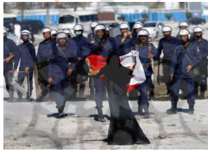
شکل ۵. تصویری مشهور از مقاومت مردم غیور بحرین در برابر ارتش بحرین و عربستان سعودی با مدیریت عناصر اطلاعاتی انگلیس و امریکا ۱

کودتای نظامیان مصری و بازگشت دیکتاتوری در مصر و سرکوب گسترده شیعیان بحرینی مقارن دانسته‌اند. اوج نهضت بیداری اسلامی مربوط به ۳۰ بهمن ۱۳۸۹ است که ارتش بحرین و آل سعود از میدان اللؤلؤه عقب نشست و میدان به دست مردم بحرین افتاد. این نهضت از تونس آغاز و در مصر، لیبی، یمن، عربستان سعودی و بحرین ادامه یافت. (شکل ۵). البته لازم به ذکر است که شیعیان مظلوم بحرین همچنان بر ضدحکومت دیکتاتوری حاکم تلاش می‌کنند و خشونت پادشاهان بحرین و عربستان سعودی نتوانسته است باعث سرکوب آن شود. چنانچه مقام معظم رهبری (مدظله العالی) فرمودند: بیداری اسلامی، فروریختن ترس ملت‌ها از ابرقدرت‌ها و احساس هویت توده‌های مسلمان در جهان اسلام، از آثار گران‌قدر انقلاب اسلامی و پایداری ملت ایران است (بیانات مقام معظم رهبری، ۱۳۸۳/۵/۲۵).