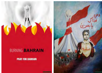
شکل ۷. آثار مشهور نهضت بیداری اسلامی (راسخوان، ۱۳۹۹)