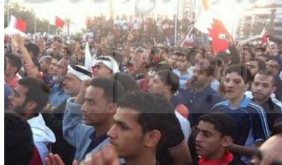
شکل ۶. عکسی تاریخی و تحسین شده از محمد الیوسف که انبوه جمعیت در اعتراض به رژیم آل خلیفه در میدان لؤلؤ را نشان می‌دهد ۱