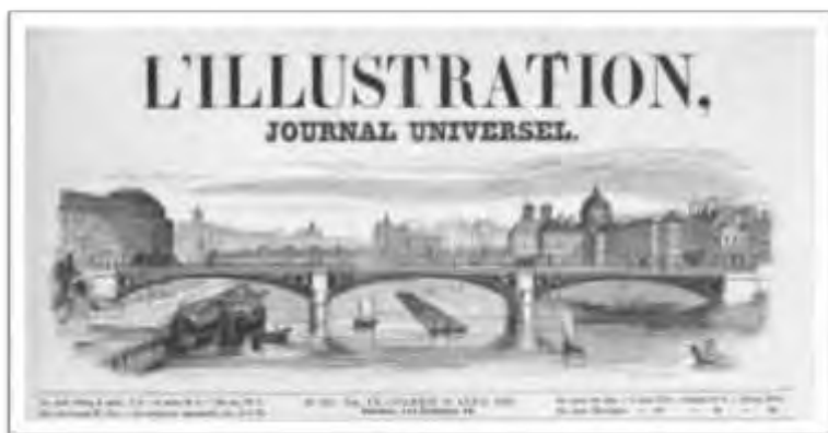
تصویر شماره ۴) مجله فرانسوی ل ایلوسترسیون، سال ۱۸۴۷ م. (کتابخانه، موزه و مرکز اسناد مجلس شورای اسلامی).