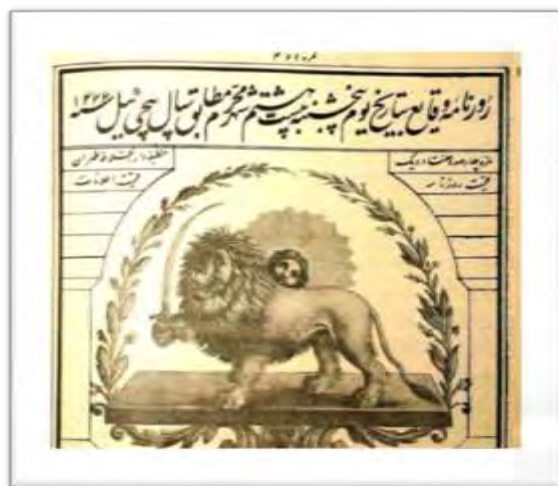
تصویر شماره ۳) روزنامه وقایع، شماره ۴۷۱، سال ۱۳۳۷ ه. ق.