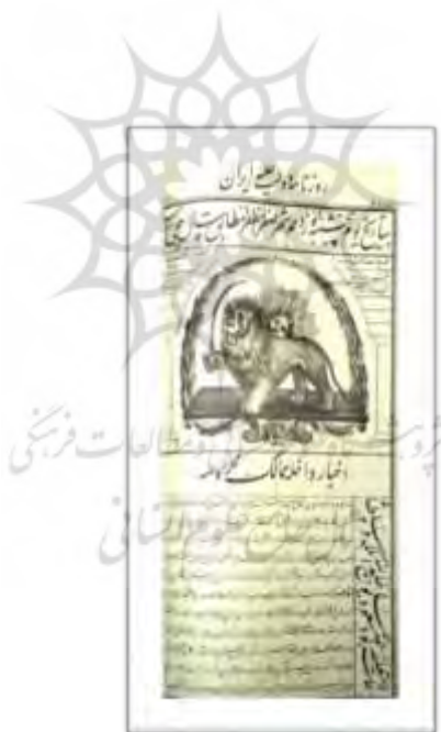
تصویر شماره ۵) نام روزنامه دولت علیه ایران بیرون از کتیبه و حاشیه اصلی، شماره ۴۷۲، ۱۲۷۷، ه. ق..