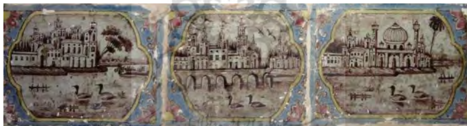
تصویر ۱۸. کاشی‌نگاره، مضمون مناظر شهری.

عکاسی مهم‌ترین فن راه‌یافته به ایران بود. پیشتر به نقش و اهمیت آن در تصاویر چهره‌نگاری و شخصیت‌ها اشاره شد. بی‌شک عکاسی را می‌توان شاخص‌ترین و جذاب‌ترین مظهر دنیای فرنگ و فن تأثیرگذار بر هنر دوره قاجار دانست که در زمینه‌های گوناگونی از ثبت تصاویر چهره‌نگاری و شخصیت‌پردازی تا مناظر معماری، طبیعت، حیات وحش و... بروز و ظهور یافت و تأثیرات عمیقی به‌جای گذاشت.