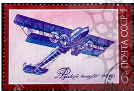
تصویر ۳۸. تمبر، طرح فناوری‌های