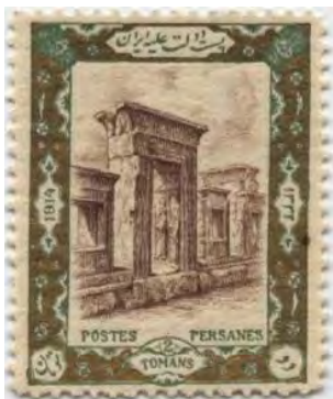
تصویر ۳۶. تمبر ایرانی، طرح بنا.