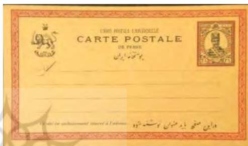
تصویر ۳۹. نخستین کارت پستال ایرانی، طرح شیروخورشید.

اهمیت کارت پستال‌ها به دلیل تصاویر متنوعی است که از مناطق مختلف جهان به واسطه آن‌ها انتشار یافت و بر هنر دوره دوم قاجار به‌ویژه کاشی‌کاری تأثیر فراوان داشت. «کارت پستال با اندکی تأخیر در اواسط سده ۱۳ ه.ق وارد ایران شد که تأثیر بسیاری در نقوش کاشی‌کاری گذاشته است» (افشار مهاجر، ۱۳۸۴: ۷۶). کارت پستال در بروز و ظهور خود و نمایش تصاویر گوناگون به فن عکاسی وابسته بود و «پیشرفت فن عکاسی موجب شد تصاویر متنوع‌تری از مناظر و آثار هنری بر روی کارت‌ها اجرا شود» (صافی، ۱۳۶۸: ۱۷). در تصاویر چاپ‌شده بر روی کارت پستال‌های این زمان تصاویری با مضامین مختلف از اشخاص و بزرگان، ابنیه تاریخی، مناظر شهری، مناظر طبیعی، حیات وحش، فناوری‌های