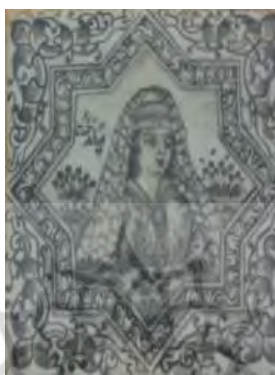
تصویر ۸. کاشی‌نگاره، مضمون شخصیت‌های