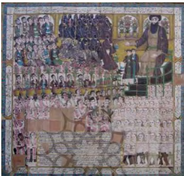
تصویر ۳. کاشی‌نگاره، مضمون عزاداری و روضه‌خوانی واقعه کربلا. (عکس از نگارنده).

۱۵۱) و کاروان‌سراهای متعدد شهر اغلب پر از بازرگانان یا زائرانی بودند که عازم زیارت کربلا بوده‌اند (جکسن، ۱۳۵۲: ۲۶۷). مجموع این عوامل در ایجاد زمینه و فضای مناسب جهت ساخت تکیه و نقاشی‌های مذهبی آن تأثیرگذار بوده‌اند.