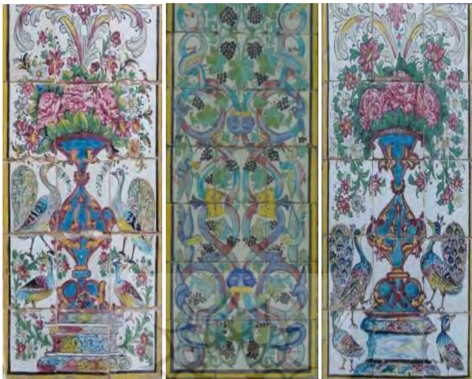
تصویر ۳۲. کاشی نگاره، مضمون گل‌ها و پرندگان..