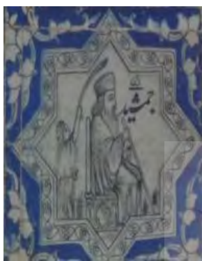
تصویر ۹. کاشی‌نگاره، مضمون پادشاهان اسطوره‌ای.

اسطوره‌ای، باستانی و تاریخی مشاهده می‌شود. در واقع این کاشی‌ها هم به جهت موضوع و مضمون و هم به جهت تکنیک و بیان دیداری متأثر از عکاسی و چاپ سنگی در جامعه قاجار هستند، چنانکه در این کاشی‌ها، تصاویر به صورت قاب‌هایی در کنار هم و تنها دارای دو رنگ هستند که اغلب نیز بر روی کاشی‌هایی با زمینه سبز (تصویر ۷)، سفید (تصویر ۸) یا آبی (تصویر ۹) تصویر شده‌اند و خط در آن‌ها حاکمیت دارد.