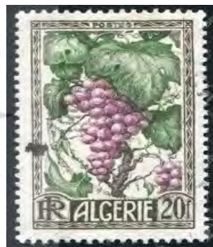
تصویر ۳۷. تمبر، طرح میوه. اواخر