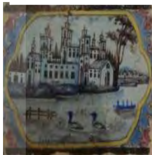
تصویر ۲۵. کاشی نگاره، مضمون مناظر شهری.