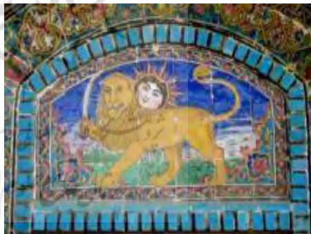
تصویر ۳۳. کاشی‌نگاره، مضمون شیروخورشید. (عکس از نگارنده).