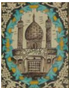
تصویر ۲۴. کاشی نگاره، مضمون بنای معماری.