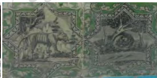
تصویر ۱۹. کاشی‌نگاره، مضمون مناظر طبیعی و حیات وحش.