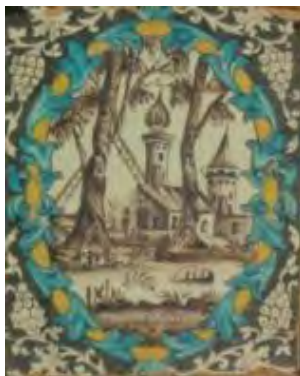
تصویر ۲۳. کاشی نگاره، مضمون مناظر شهری.