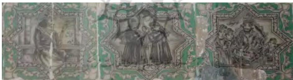
تصویر ۵. کاشی‌نگاره، مضمون پادشاهان باستانی و اسطوره‌ای.

باستانی سعی داشتند با احیای غرور ملی و ترویج ملی‌گرایی و وطن‌پرستی در میان مردم، موجبات تجدید حیات عظمت و شکوه منسوب به ایران باستان را فراهم آورند (علی‌زاده و طرفداری، ۱۳۸۹: ۴ و ۱۶۳). این رویکرد بیشتر در نقش برجسته‌ها و تابلوهای نقاشی تبلور یافت. فتحعلی‌شاه با رواج تصاویر باشکوه همانند موضوعات شاهنامه به گونه‌ای اسطوره‌سازی کرد و با تداعی خاطرۀ نقش‌برجسته‌های دوران ساسانی، به چالش گذشته پادشاهی ایران پاسخ داد (علیمحمدی‌اردکانی، ۱۳۹۱: ۶۳). در این آثار بیشترین میزان تأثیرپذیری، الگوبرداری و همانندسازی با فرهنگ و هنر دورۀ ساسانی مشاهده می‌گردد (تصویر ۲)، چنانکه اغلب نقوش برجسته قاجار متأثر از آثار ساسانی و حتی در همان مکان‌ها شکل گرفتند. علت این امر را باید شناخت بیشتر فرهنگ و تمدن ساسانی در این زمان و آثار باقی‌مانده از آن دانست (حاجی‌علیلو، ۱۳۸۶: ۵۶ و ۳۲). نمونه‌ای از این نقش برجسته‌ها در طاق‌بستان و در کنار آثار ساسانی آن به جای مانده است.