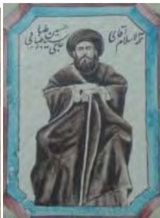
تصویر ۱۲. کاشی‌نگاره، مضمون شخصیت‌های معاصر.

دورهٔ جنگ‌های ایران و روس، پیش‌درآمد آشنایی ایرانیان با تجدد بود. تماس سیاسی قاجارها با غرب که راه عمدهٔ انتقال علوم جدید محسوب می‌شد، زمینهٔ انتشار فرهنگ غربی در ایران را فراهم کرد و بیان هنر را متحول ساخت. در این میان سفرهای شاه قاجار نیز بسیار تأثیرگذار بود. ناصرالدین‌شاه نخستین شاه ایران بود که سه بار به اروپا سفر کرد و این دیدارها موجبات گسترش، نوآوری و فرنگی‌سازی در ایران را فراهم آورد (اکبری و آذری، ۱۳۸۸: ۱۱؛ آژند، ۱۳۸۵: ۷). ورود مظاهر دنیای غرب و ظهور ابزارهای جدید، چون تلفن و تلگراف، توسعهٔ صنعت چاپ، پیدایش روزنامه و شکوفایی عکاسی از موارد بسیار تأثیرگذار عصر ناصری بود که تا پایان دورهٔ دوم حکومت قاجارها ادامه یافت. هم‌زمان با عصر ناصری که ایران و اروپا تماس گسترده‌ای را تجربه می‌کردند و تحولات بسیاری در همهٔ ابعاد شکل می‌گرفت و خبر از دورانی متفاوت می‌داد، عکاسی شکوفا شد. هنر عکاسی که بارزترین پدیدهٔ نمایش شکل‌گیری این دوران نوین بود، بر هنر نقاشی تأثیر