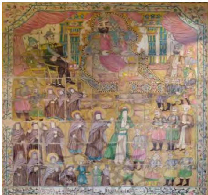
تصویر ۲. کاشی‌نگاره، مضمون واقعه کربلا.

می‌انداختند»، و نمایندگان و سفیران اروپایی را برای تماشای تعزیه به تکیه‌ها و خانه‌هایشان دعوت می‌کردند (بیضایی، ۱۳۸۷: ۱۲۱ و ۱۱۷؛ شهیدی، ۱۳۸۰: ۱۰۷).