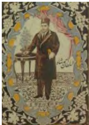
تصویر ۱۳. کاشی‌نگاره، مضمون پادشاهان قاجار.