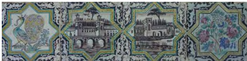
تصویر ۲۱. کاشی‌نگاره، مضمون گل‌ها و مناظر شهری و حیات وحش.

یحیی ذکاء در این باره می‌گوید: «یکی از تحولات دوره قاجار فن عکاسی است که در ۱۲۶۶ ه. ق وارد ایران شد. این دانش جدید به دلیل ویژگی‌های منحصر به فردش که در آن زمان آرزوی بشر بود، بسیار مورد توجه همه به‌ویژه شاه و درباریان قرار گرفت. این فن درنگاره‌های ایران تأثیر فراوان داشت. چنان‌که در کاشی‌نگاره‌های این عصر طرح‌هایی می‌بینیم که مانند پرتره عکاسی شده از شخصیت‌های مهم مملکت و یا بناهای ساختمانی و برخی مناظر طبیعی و تصاویری از حیوانات است. چه پیش از این برای تزیین بناها از تصاویر ابنیه و منظره‌هایی از طبیعت و حیوانات استفاده نمی‌شد. همین‌طور در قاب قرار گرفتن این تصاویر نیز خود حاکی از این تأثیرپذیری است. چون همواره در تزیینات پیش از قاجار، نقوش در حال گسترش مانند شاخ و برگ اسلیمی که در سطح گسترش پیدا می‌کردند، استفاده می‌شد و تصاویر قاب شده از این دوران به بعد رواج پیدا کرد و از طرف دیگر نگاره‌ها دارای حالت واقع‌گرا شدند و اصول عمق میدان (پرسپکتیو) و سایه‌روشن در بسیاری از آن دیده می‌شود. همچنین سیاه‌وسفید بودن برخی نگاره‌ها، دلیلی دیگر است که نشان می‌دهد بسیار از کاشی‌نگاره‌ها از عکس‌های آن دوره الگو برداشته‌اند» (ذکاء، ۱۳۷۶: ۴-۱۴).