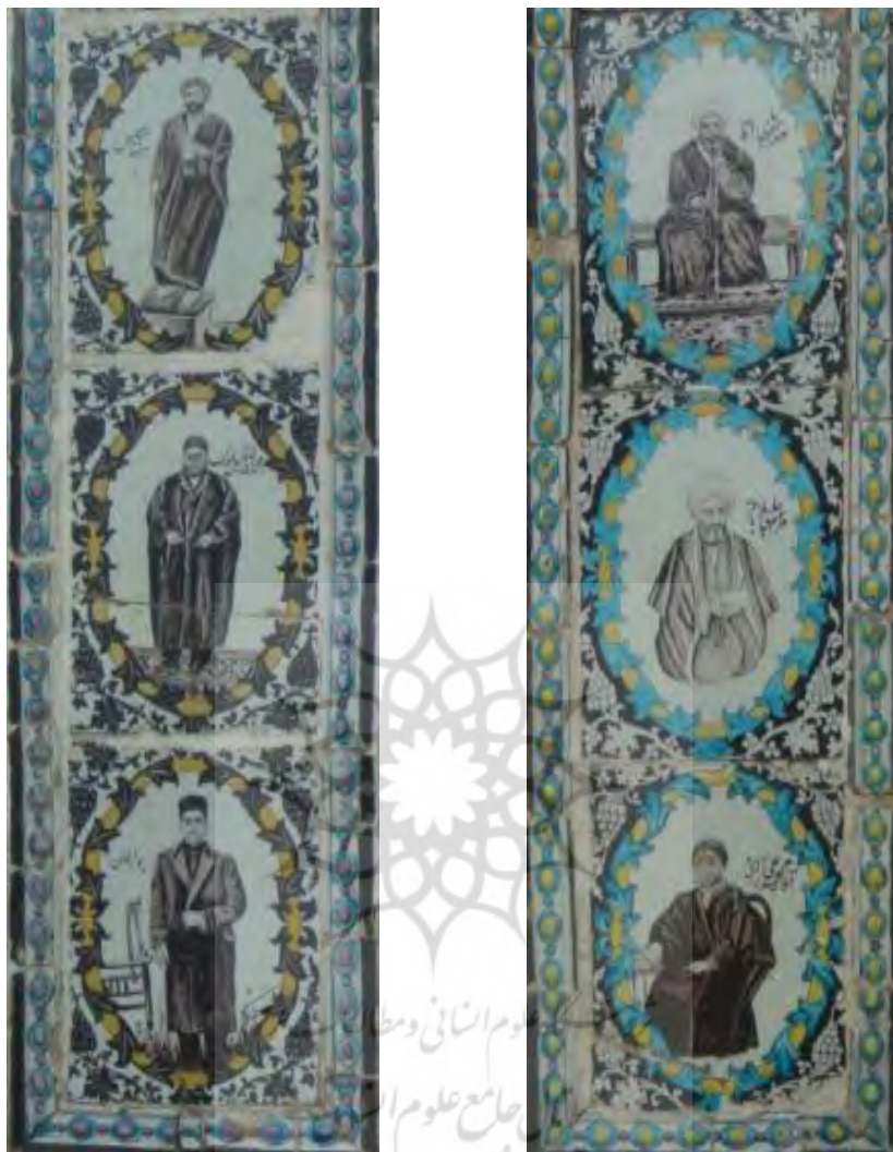
تصویر ۱۶. کاشی‌نگاره، مضمون شخصیت‌های معاصر.