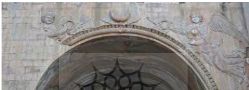
تصویر ۱۱. نقش برجسته فرشته‌های بالدار. طاق‌بستان.