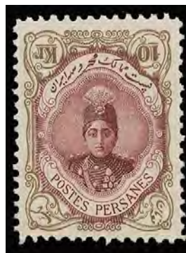
تصویر ۳۵. تمبر ایرانی، طرح