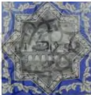
تصویر ۲۶. کاشی نگاره، مضمون فناوری‌های.