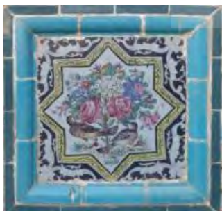
تصویر ۲۹. کاشی نگاره، مضمون گل‌ها و پرندگان.