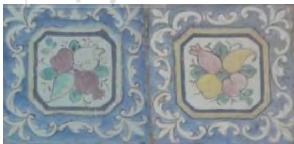
تصویر ۲۸. کاشی نگاره، مضمون میوه‌ها.