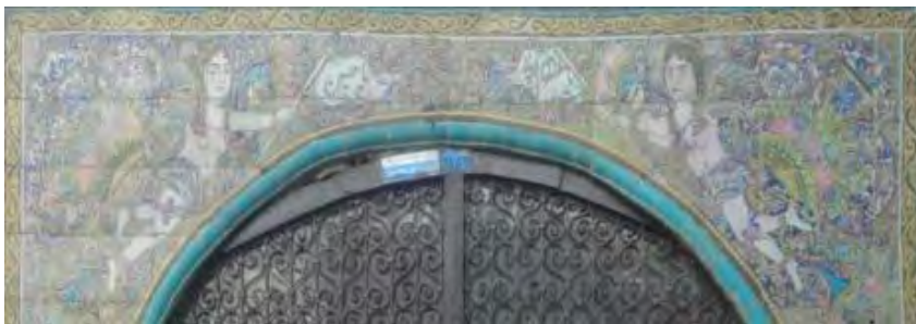
تصویر ۱۰. کاشی‌نگاره، مضمون فرشته‌های بالدار.