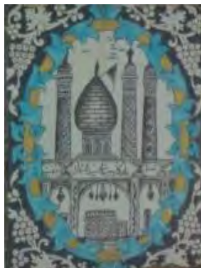
تصویر ۲۲. کاشی نگاره، مضمون بنای معماری.