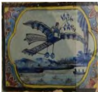
تصویر ۲۷. کاشی نگاره، مضمون فناوری‌های جدید.