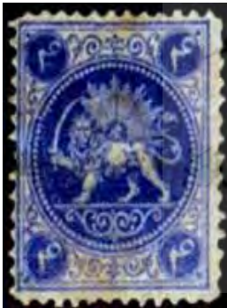
تصویر ۳۴. نخستین تمبرهای ایرانی، طرح شیروخورشید.