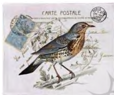
تصویر ۴۰. کارت پستال، طرح پرنده، اواخر قاجار. ( http://pinbrowse.com ).

رجال قاجار از اروپا که بر روی کارت پستال نوشته شده است، بیانگر رواج آن در ایران همزمان با گسترش آن در اروپا است (بمانیان و دیگران، ۱۳۹۰: ۴۱). از سال ۱۲۹۳ ه.ق/۱۲۵۶ ش همزمان با طراحی نخستین تمبرهای ایرانی، کارت پستال‌هایی نیز با نوشته فرانسوی به نام ایران و با نشان شیروخورشید بر زمینه‌های رنگی چاپ شد (نوبین فرح‌بخش، ۱۳۷۹: ۷) (تصویر ۳۹).