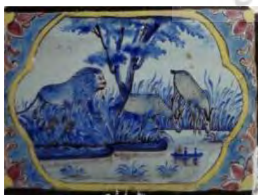
تصویر ۲۰. کاشی‌نگاره، مضمون حیات وحش.