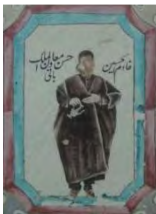
تصویر ۱۴. کاشی‌نگاره، مضمون شخصیت‌های معاصر.