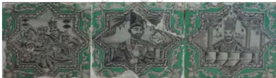
تصویر ۶. کاشی‌نگاره، مضمون شاهان تاریخی و شخصیت‌های اسطوره‌ای.