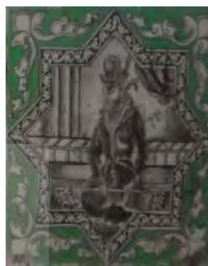
تصویر ۷. کاشی‌نگاره، مضمون پادشاهان تاریخی.

کاشی‌نگاره‌هایی نیز با مضمون فرشته‌های بالدار در تکیه معاون به شکل‌های متنوعی تکرار شده‌اند (تصویر ۱۰). این کاشی‌نگاره‌ها که تأثیر نقش برجسته فرشته بالدار (نیکه) از نقوش ساسانی طاق‌بستان بر آن‌ها مشهود است (تصویر ۱۱)، وجه دیگری از گرایش به ایران باستان در هنر دوره قاجار را بازنمایی می‌کنند.