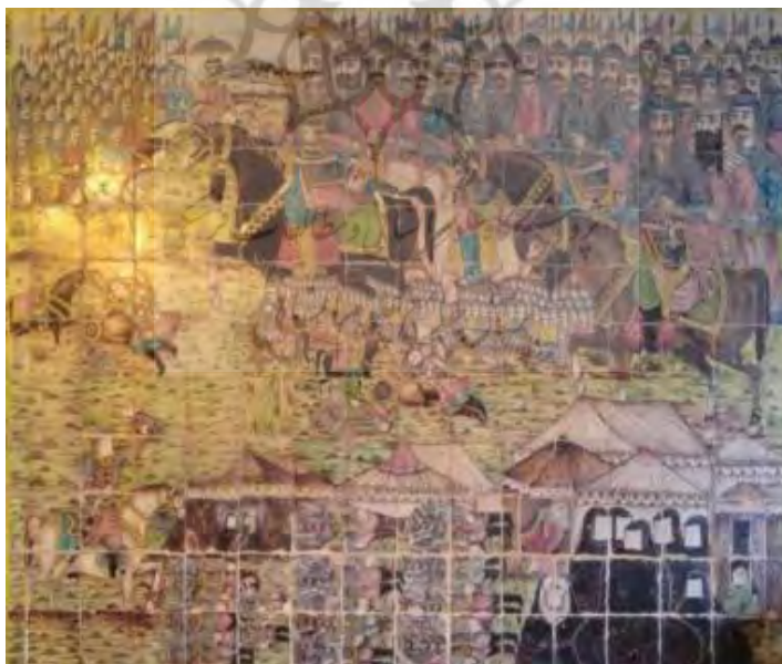
تصویر ۱. کاشی‌نگاره، مضمون واقعه کربلا.

متن‌های مرتبط به خود اختصاص داده‌اند. روایت‌های تصویر شده بر این کاشی‌ها همان روایات مذهبی دیگر تکایا براساس سنت نقاشی قهوه‌خانه‌ای و پرسپکتیو مقامی است. دوره قاجار اوج دیوارنگاری مذهبی بود و مردم عادی را وارد صحنه هنر کرد. دیوارنگاری افزون‌بر دربار در برخورد با جامعه، پاره‌ای از رویکردها و باورهای مردم را نیز بازنمایی می‌کرد. هنرمندان در کاشی‌نگاری‌ها و گچ‌نگاری‌های بسیاری، وقایع کربلا و مضامین مذهبی دیگر را به موازات رواج گرایش‌های مذهبی بر دیوار تکایا و حسینیه‌ها به نمایش گذاشتند که بازنمایی جلوه‌های گوناگون عقاید مردمی و بخشی از باورهای همگانی جامعه قاجار بودند (حسینی‌راد و عزیززادگان، ۱۳۹۰: ۳۵. آژند، ۱۳۸۵: ۴۱). بر طبق رویکرد بازتاب، هنر آینه‌ای است که در برابر جامعه قرار داده شده است (الکساندر، ۱۳۹۰: ۶۸) و «هیچ چیز جدیدی را خلق نمی‌کند، بلکه شیوه‌های جدید و هوشمندانه‌تر بیان معانی رایج میان مردم است که با معانی موقعیت‌ها فهمیده می‌شود» (فاضلی، ۱۳۷۴: ۱۲۹).