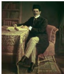
تصویر ۴. حکیم‌الملک، ۱۳۲۸ ه.ق، رنگ و روغن بر روی بوم، موزه نیوران

عناصر دیگری توسط نقاش ترسیم شده است که می‌تواند در شناخت موقعیت سیاسی و اجتماعی شخصیت‌ها یاری‌رسان باشد؛ از آن جمله به کتاب‌هایی می‌توان اشاره کرد که در کنار دست بر روی میز است و کتابخانه‌ای که پشت سر قرار دارد و یا قلم و دوات کنار دست سردار اسعد. دقت در نشانه‌هایی که در تصویر است نشان می‌دهد که هر دو شخصیت به طبقه روشنفکر تعلق دارند: «حکیم‌الملک که بر اثر ده سال اقامت در اروپا روشنفکر و آزادی‌خواه بار آمده بود خدمت دربار را موافق طبع خود نیافت و بدین سبب پس از مرگ مظفرالدین‌شاه از دربار و درباریان کناره گرفت [...] و در استقرار مشروطیت با دیگر آزادی‌خواهان همگام و هم‌آواز شد.» (یغمایی، ۱۳۴۹: ۳۳). ۱ پس از به توپ بستن مجلس و قتل و سرکوبی مشروطه‌خواهان توسط محمدعلی‌شاه، سردار اسعد بختیاری که دارای موقعیت اجتماعی ممتاز در میان ایل بختیاری بود با کمک محمدولی‌خان تنکابنی تهران را فتح کرد و به تثبیت موقت دولت مشروطه و شکست «استبداد صغیر» یاری رساند: «علیقلی‌خان سردار اسعد [...] از خوانین فرهنگ‌دوست بختیاری بود. او طی دوران زندگی