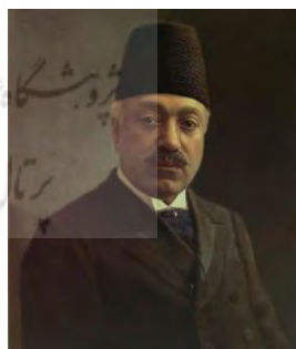
تصویر ۷. ناصرالملک، ۱۳۲۹ ه.ق، رنگ و روغن بر روی بوم، موزه دفینه