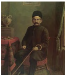
تصویر ۵. علیقلی‌خان سردار اسعد، ۱۳۲۸ ه.ق، رنگ و روغن بر روی بوم، موزه مجلس