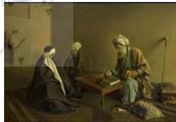
تصویر ۱. رمال، ۱۳۰۹ ه.ق، رنگ و روغن بر روی بوم، کاخ سعد آباد