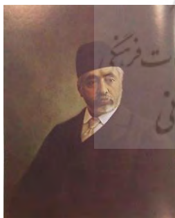
تصویر ۸. مرتضی قلی‌خان صنیع‌الدوله، ۱۳۳۱ ه.ق، رنگ و روغن بر روی بوم، موزه مجلس، (سهیلی خوانساری، ۲۸۴: ۱۳۶۸)

در میان شش اثر یادشده تک‌چهره ناصرالملک قره‌گوزلو (تصویر ۷) و مرتضی قلی‌خان صنیع‌الدوله (تصویر ۸) شبیه به هم نقاشی شده‌اند. جنبه‌های روان‌شناختی هر دو شخصیت در کار نقاش قابل درک است؛ هر دو لباس‌هایی مرتب و رسمی چنان که سزاوار یک سیاست‌مدار است به تن دارند. برخلاف ناصرالملک، نگاه صنیع‌الدوله به بیننده دوخته نشده است. در این دو کار نیز شبیه‌سازی عکس‌گونه از روی چهره با مهارت انجام گرفته و نقاش تلاش کرده است شأن و جایگاه هر دو سیاست‌مدار را چنان که شایسته است به تصویر بکشد.