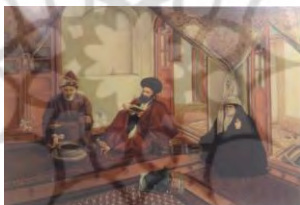
تصویر ۳. جن‌گیر (منسوب به کمال‌الملک)،

نگاه توأم با انفعال زنی که روبندۀ خود را کنار زده و نگاه خیره زن دیگر که روبه‌روی رمال است (تصویر ۱) و خنده و دست زیر چانه زنی که در وسط نشسته و نگاه‌های توأم با لبخند پیرمرد نشسته در وسط و زن جوانی که طالع او قرار است بیان شود، نشان‌دهنده این مسئله است (تصویر ۲). اثری دیگر وجود دارد که به کمال‌الملک منسوب است و در آن به گونه‌ای طنزپردازانه عمل جن‌گیری را به تصویر کشیده است ۱ (تصویر ۳). بسیاری از عناصر ذکرشده در دو اثر بالا، در این اثر به چشم می‌خورد. تنها تفاوت آن در اجرای عمق‌نمایی و سایه‌روشن‌کاری است که ضعف آن در مقایسه با دو اثر بالا مشهود است و به احتمال زیاد مربوط به پیش از سفرش به اروپاست، اما از اهمیت موضوعی آن کاسته نمی‌شود.