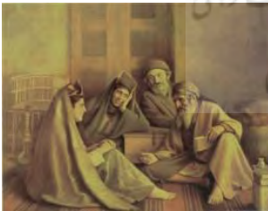
تصویر ۲. فالگیر بغدادی، ۱۳۱۶ ه.ق، رنگ و روغن بر روی بوم، موزه مجلس

از آثار در آستانه یا پیش از مشروطه کمال‌الملک که سویه اجتماعی آنها برجسته است، می‌توان به «عموصادق شیرازی؛ ۱۳۰۸ ه.ق»، «مادر و دخترگدا؛ ۱۳۰۸ ه.ق»، «رمال؛ ۱۳۰۹ ه.ق»، «عرب در خواب؛ ۱۳۱۲ ه.ق»، «فالگیر بغدادی؛ ۱۳۱۶ ه.ق» و «زرگر بغدادی؛ ۱۳۱۹ ه.ق» اشاره کرد. در میان آثار نامبرده دو اثر وجود دارد که با روح مشروطیت و نیز با گفتمانی که روشنفکران در آن دوران مطرح کردند ارتباط مستقیم دارد: «رمال» (تصویر ۱) و «فالگیر بغدادی» (تصویر ۲). در هر دو اثر که به نظر ساختی روایت‌گونه دارند نوعی وحدت رویه در اجرای کار به چشم می‌خورد. پیکره‌ها در فرمی مثلث‌شکل در وسط قاب قرار دارند و نقاش در اجرای تکنیکی اثر دقت خود را به کار بسته است. سایه‌روشن‌کاری دقیق است و پیکره‌ها با مهارت نقاشی شده‌اند. حالت چهره‌ها واقع‌گرایانه است و شبیه‌سازی از روی صورت با مهارت انجام گرفته است. در هر دو، رمال دست راست را به اشاره به سوی شخصی که قرار است طالعش بیان شود برده و لباس رمال‌ها شبیه به هم است؛ دستاری بر سر است و عبایی بلند بر تن. در چهره رمال‌ها نوعی اعتماد به نفس مشاهده می‌شود و از سوی دیگر در چهره اشخاصی که نزد رمال‌ها هستند نیز نوعی احساس رضایت توأم با تسلیم است.