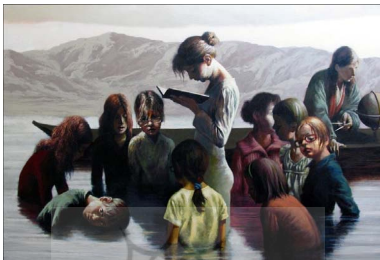
تصویر شماره 5

در تبیین جامعه‌شناختی چنین مفاهیم و تفاسیری که از اثر به دست دادیم - همانند اثر قبلی - محیط غیرمعمول زیست و تجربه‌ی فیگورهای انسانی قابل توجه می‌نماید. در تصویر «تجربه‌های روزمره»ی زندگی چون آموزش، تکامل و بلوغ افراد به قدری طبیعی و بی‌واسطه می‌نماید که تعارضی سخت با پیرامون نامعمول آن به وجود می‌آورد. تعارضاتی صلب و سخت که ذهن را به سمت تجربه‌های ناقص و ناکامل، اما گریزناپذیر زندگی هدایت می‌کند. تجاربی که با همه‌ی نواقص و تعارضاتش، حتی در شرایط غیرمعمول و نابهنجار اجتماع‌مان همچنان با قدرت به زیست خود ادامه می‌دهند. در حضور جغرافیای دان نیز شاید بتوان تأثیرات غرب و تجدد بر اذهان و سبک زندگی و حتی غربی‌بودن شکل آموزش مدرسه‌ای را نیز پی‌گیری کرد؛ چنانچه تجدد ما در آغاز خود و در تصویرش در نقاشی کمال‌الملک نیز وامدار باروک است. تصویر 2 (1389): سه جراح را در حالت‌های مشابه در حالی که گویی مشغول جراحی‌اند در مقابل سه تلویزیون می‌بینیم، اما مشخص نیست جراح‌ها چه چیز را جراحی می‌کنند. تصویری