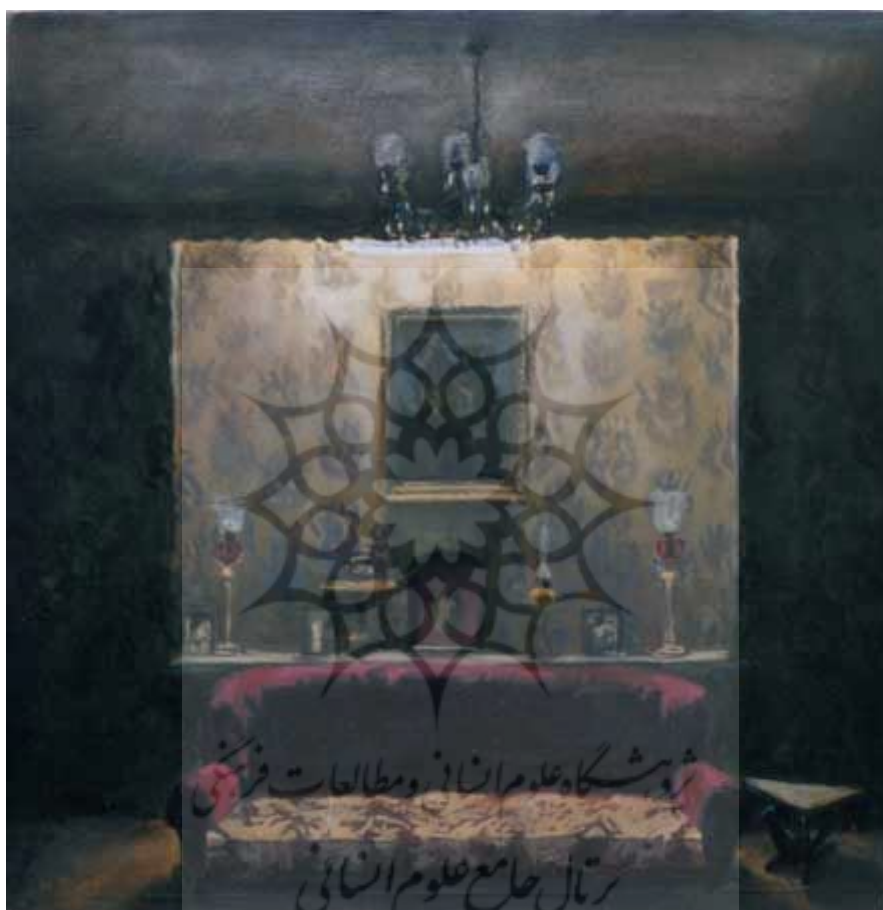
تصویر شماره 3

تأمل برانگیز است. این ترکیب‌بندی با استفاده از قرینگی و خطوط ایستای عمودی و افقی سکون و آرامش تصویر را بیشتر نیز می‌کند.