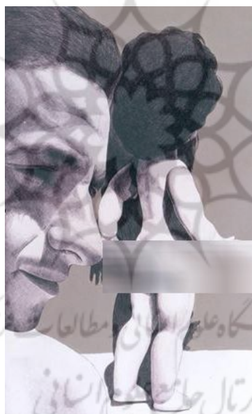
تصویر شماره 2

موانعی بر سر راه تجربه‌ای کامل و بی‌واسطه از زندگی و بلوغ و تکامل ایجاد کرده و دغدغه‌هایی که در ذهن و زندگی فرد می‌آفرینند. زنانی که شرایط از جسمیت‌شان موجودیتی عروسک‌گونه آفریده و جسمیت‌شان تنها ویژگی جنسیت‌شان تلقی می‌شود و مردانی که چون قربانیان این شرایط از تجربه‌ی زندگی و بلوغ و تکامل وامی‌مانند، چنانکه چون کودکانی نابالغ، حسرت بازی را با خود تا دوران بزرگسالی حمل می‌کنند و امکان رشد و تجربیاتی کامل‌تر را نیز از دست می‌دهند.