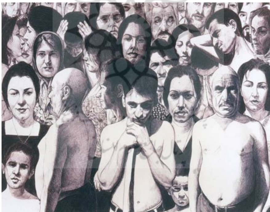
تصویر شماره 1

تصویر 1: سطحی مملو از فیگورهای متراکم انسانی که هر یک به دقت شخصیت‌پردازی شده‌است. بی‌شکلی و تراکم این توده‌ی انسانی حس خفگی ناخوشایندی متبادر می‌کند؛ حسی که البته در چهره‌ی خود فیگورها مشاهده شدنی نیست. هیچ ارتباط ملموسی بین افراد به مثابه عناصر تصویر و هم‌چنین اجزای یک کل واحد که از فضای کلی تأثیر می‌گیرند وجود ندارد؛ طوری که گویی هر یک فارغ از دیگران، در عوالم جداگانه‌ی خویش سیر می‌کنند. یگانه‌ی خاصیت وحدت‌بخش تصویر وجود منبع نوری واحد است که حس بودن در فضایی واحد را به‌وجود می‌آورد. شخصیت‌پردازی افراد البته چهره‌هایی کاملاً ملموس و مادی و روزمره آفریده که هر یک به راحتی حس همذات‌پنداری مخاطب را برمی‌نگیزد.