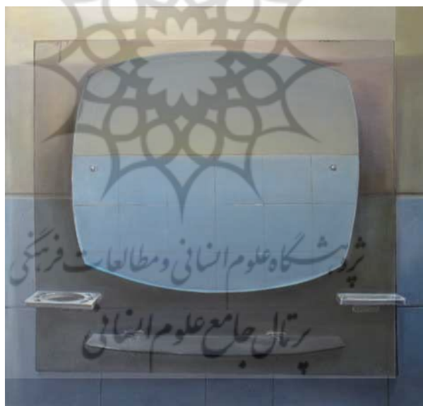
تصویر شماره 4

پر فراز و نشیب‌تر. این قاب گویی مخاطبی با حافظه‌ی مشترک را به درون تصویر فرامی‌خواند و او را در برابر آینه‌ای از زیست‌اش قرار می‌دهد. آینه همچنین نشانه‌ای است که دلالتی بر خودانتقادی دارد. این کار بر خلاف اکثر آثار افسریان عمق کمی را می‌نماید و حتی تصویر دیوار مقابل، که به واسطه‌ی انعکاسش در آینه به پلانی جلوتر منتقل شده است، به شدت از همین عمق کم نیز می‌کاهد و بیننده را در برابر دیواری سخت با تصلبی ناگوار مواجه می‌کند. این سختی انتظار کسی را می‌کشد که به واسطه‌ی حضورش به دلالت آینه معنا دهد. تصلبی که دور نیست تا آن را به سنت و اندیشه‌ای نسبت دهیم که به واسطه‌ی تکرار اشتباهاتمان با تصلب بیشتر مواجهش می‌کنیم. این ناگواری را چاره‌ای نیست جز آنکه خود را در قاب خودانتقادی تصویر زندگی‌مان ببینیم.