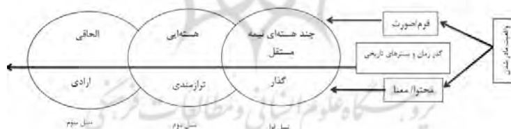
شکل ۲. ارتباط انتظام معنایی مادری و فرم خانواده

در مادری ارادی، توسعه دانش و به‌خدمت‌گرفتن تکنولوژی در حوزه تخصصی فرزندآوری، مفاهیم جدیدی مانند لقاح مصنوعی، اهدای تخمک، رحم جایگزین را تولید می‌کند که بارداری تا حدود زیادی بی‌نیاز از بدن مادر امکان‌پذیر می‌شود و به این صورت با تفکیک‌شدگی عناصر حیاتی در فرایند فرزندآوری و واگذاری نقش محول ۱ به آزمایشگاه‌ها یا رحم‌های اجاره‌ای، امکان صورت‌بندی‌های متعدد از مادری فراهم می‌شود. همچنین محدودیت‌های مرتبط با بدن زن و دوره باروری نیز امکان کنارگذاشته‌شدن پیدا می‌کنند. نتیجه اینکه معنای مادرشدن به میانجی‌هایی مانند بهداشت، پزشکی و تکنولوژی مادرشدن، با بازشناسی شناخت از بدن نزد زنان در دوره‌های مختلف مفصل‌بندی می‌شود و از گذر این تغییر نظام معنایی مادری است که صورت‌های خانواده در ضرورت‌های تاریخی دگرگون می‌شود. سه گونه نظام معنایی از مادرشدن (گذار، ترازمند و ارادی) به ترتیب مرتبط با سه فرم نیمه‌هسته‌ای، نیمه‌مستقل، هسته‌ای و الحاقی بر مبنای مؤلفه‌های سنخ آرمانی و توالی زمانی شناسایی شده در شکل ۲ آورده شده است.