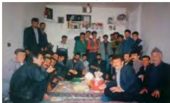
تصویر ۳: عید دینی اهالی روستای زئورام در سال ۱۳۷۰

(۱۱) گنجه و طاقچه: فضایی کنده شده در داخل دیوار ایوان یا اتاق است که معمولاً لباس‌های زنان و متوفایان در آن نگهداری می‌شود و کلید آن معمولاً در دست مادر خانه است. گنجه به همراه مهمان‌خانه فضاهای شاعرانه خانه می‌باشند، گنجه مخفی‌گاه و محل نگهداری رازهای زنان است، درون گنجه یک صندوقچه وجود دارد که سرشار از بوی هل و میخک است. «صندوق چیزهایی دارد فراموش نشدنی، هم برای ما و هم برای آن‌هایی که گنجه‌هایمان را به ایشان خواهیم بخشید، در صندوقچه حال و آینده به هم گرد می‌آیند» (باشلار، ۱۳۹۶: ۱۲۷). در این صندوقچه لباس‌ها، زیورات و هدایای متوفایان خانواده نگهداری می‌شوند. فضای صندوقچه فضایی کهنه، عمیق و صمیمی است که رو به هرکسی گشوده نمی‌شود؛ این فضا سرشار از حرف‌های ناب و حزن‌انگیز است که با باز شدنش ما را به آنسوی جهان آسمانی می‌برد که در فضای واقعی زندگی آن را فراموش کرده‌ایم. «با باز شدن صندوقچه دیالکتیک درون و برون به پایان می‌رسد، بیرون دیگر معنایی ندارد، حتی ابعاد مکعبی آن معنای خود را گم می‌کنند زیرا بُعدی تازه-بُعد صمیمیت تازه- پیدا شده است» (باشلار، ۱۳۹۶: ۱۲۸).