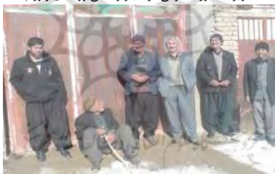
تصویر ۷: حوزه عمومی در آسیاو و اهالی روستای زئورام

معنادهی به مکان سبب آشنایی با قلمرو و خوانایی آن می‌شود؛ بنابراین شدت روابط اجتماعی، شکل‌گیری هویت جمعی و تاریخ مشترک در درون خانه، منطقه مسکونی و تمام قلمرو روستا باعث شده که روستاهای کاکاوند به «مکان‌های انسان‌شناختی» تبدیل کرده شوند.