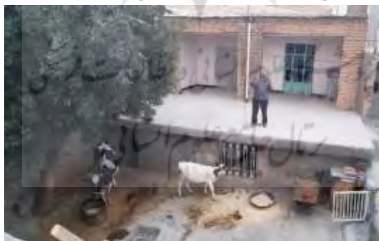
تصویر ۲: نمایی از معماری یک خانه روستایی در زئورام، تابستان ۱۳۹۷

۱۰) ایوان و اتاق‌های اصلی: در انتهای حیاط، بخش اصلی خانه قرار می‌گیرد که در ارتفاعی ۱,۵۰ تا ۲ متر از کف حیاط قرار دارد. این بخش شامل ایوان و اتاق‌های اصلی است. ایوان بخش نیمه‌درونی و نیمه‌برونی خانه است و در پیشگاه اتاق‌های