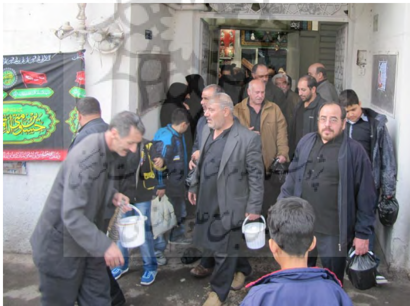
منبع: نگارنده، آذر ۱۳۹۱

موضوع کلیدی برای یک مردم‌نگار، تجربه است. مسئله برای مردم‌نگاری چشایی حاضر آن است که خوردنی‌ها و امور مرتبط به آنها چه تجربه مناسکی‌ای را در افراد ایجاد می‌کنند؟ برای