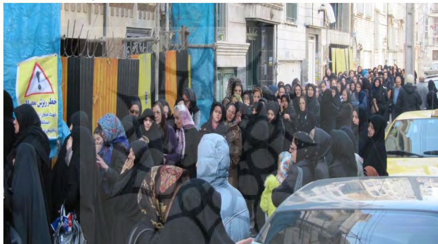
عکس ۳: صف غذای نذری، بخش خانم‌ها، خیابان کارگر جنوبی

وعده‌هایی غذایی به ویژه نهار و شام در روزهای نهم (تاسوعا) و دهم (عاشورا) وجود دارد. به همین ترتیب، در صف غذا ایستادن بخشی از اعمال شرکت‌کنندگان می‌شود. بخش مهمی از زمان عزاداران مناسک محرم صرف تهیه غذا از یک طرف و ایستادن در صف غذا از طرف دیگر می‌شود. ایستادن در صف توزیع غذای نذری را بایستی همانند دیگر اعمال مناسکی مانند گریه کردن، سینه زدن، زنجیر زدن، تماشا کردن، نوحه خواندن، برداشتن علم و ... تحلیل کرد. بدین ترتیب، ایستادن در صف غذای نذری نیز یک عمل مناسکی است. هر عمل مناسکی بایستی دارای نقشی کارکردی و معنایی در مجموعه کل مناسک باشد.