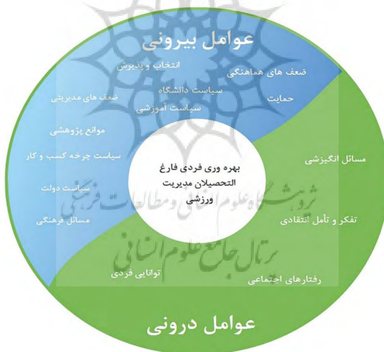
شکل ۱- مدل زمینه‌ای توسعه بهره‌وری دانش‌آموختگان حوزه مدیریت ورزشی

سرانجام پس از شناسایی مفاهیم اولیه، مقوله‌های فرعی و مقوله‌های اصلی مدل زمینه‌ای توسعه بهره‌وری دانش‌آموختگان حوزه مدیریت ورزش به‌منابه بهره‌وری فردی، در شکل شماره یک طراحی شدند. دلیل انتخاب بهره‌وری فردی به‌عنوان هسته اصلی این بود که بیشتر پاسخ‌دهندگان اذعان کردند، منظور از بهره‌وری دانش‌آموختگان، کارا و اثربخش کردن این بخش از جامعه علمی کشور است. برخی دیگر نیز اعتقاد داشتند، بهره‌وری دانش‌آموختگان قابل قبول بودن نسبت داده‌ها به ستاده‌ها و دریافت ستاده بیشتر است. علاوه بر این، بهبود فرایندهای مدیریتی آینده و بهبود قابلیت اشتغال دانش‌آموختگان از جمله دیگر معرف‌های بهره‌وری دانش‌آموختگان بود که با بررسی قرابت معنایی بین آن‌ها و استناد به مبانی و ادبیات تحقیق هسته اصلی، «بهره‌وری فردی» نام‌گذاری شد و عوامل دیگر در ارتباط با آن بررسی شد.