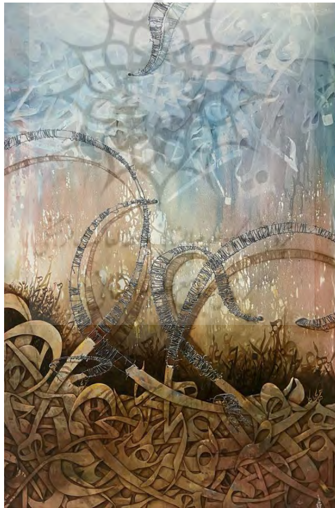
شکل ۱- خط-نقاشی با عنوان «تقدیر» از مهدی زمانی

در تحلیل متن بصری (نقاشی) ابتدا لایه‌های فرانشی متن نقاشی را تجزیه و تحلیل خواهیم کرد. از جنبه طراحی بصری بر پایه نظریه کرس و لوون (2006) سه فرانشی بازنمودی، تعاملی و ترکیبی را مورد بررسی قرار خواهیم داد.