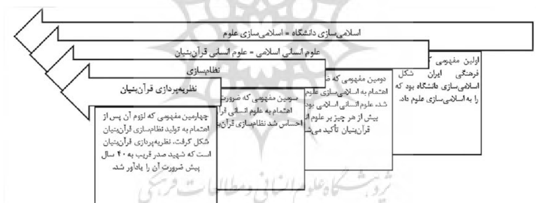
نمودار ۱: سیر شکل‌گیری مفاهیم در ایران

۱) سیر پیدایش مفاهیم و ترتیب ذهنی آنها: سیر شکل‌گیری مفاهیم در ایران که شمار قابل توجهی از دانشمندان حوزه و دانشگاه را به خود مشغول کرده در نمودار زیر نشان داده شده است. موازی بودن نمودار بدین معنی است که هر یک از مفاهیم مستقل از دیگری یک هدف به شمار می‌آید. ترتیب آن‌ها نشان می‌دهد که به ترتیب هر مفهوم بالاتر مستلزم تحقق مفهوم پایین آن است. ترتیب ذهنی فوق نشان می‌دهد که مبانی هر یک از مفاهیم بالا مبنای مفاهیم پایین‌تر نیز خواهد بود.