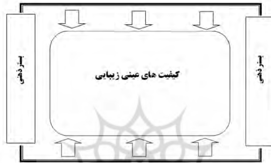
شکل ۱: رابطه بین پیش‌زمینه‌های ذهنی و کیفیت‌های عینی زیبایی (ماخذ: نگارندگان)

نظاره‌گر، مانند خاطرات و دیگر فاکتورهای تاثیرگذار بر ذهنیت انسان، بستری ذهنی برای ادراک زیبایی‌ها فراهم می‌کند که در این بستر شرایط برای ادراک پدیده‌های طبیعی و ماهیت کالبدی آن فراهم است؛ به عبارت دیگر ذهنیت و پیش‌زمینه‌های ذهنی موجود در ارتباط با محیط همچون بستری می‌باشند که زیبایی‌های مادی را تحت تاثیر قرار می‌دهد و کیفیت‌های زیبایی‌شناسی را در دیدگان ناظر شکل می‌دهد. شکل ۱ این مطلب را به شکل گرافیکی نشان می‌دهد.