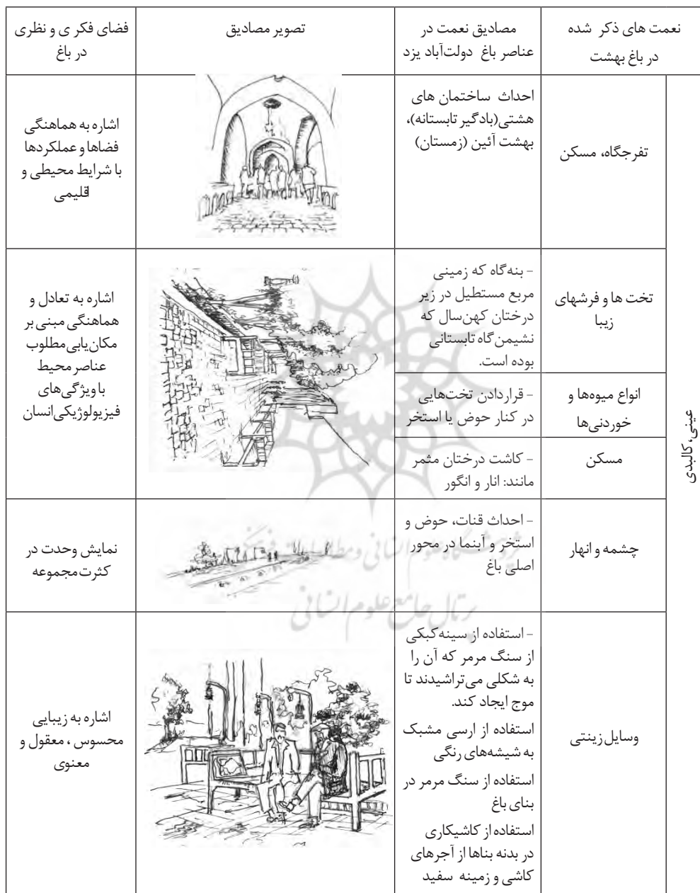
جدول ۳- بازخوانی عناصر در بهشت قرآنی و باغ دولت آباد