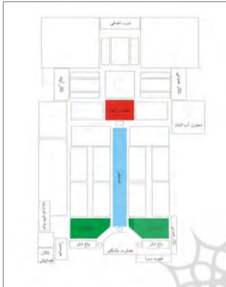
رسم مجدد سایت پلان باغ دولت آباد یزد، نگارندگان ۱۳۹۱