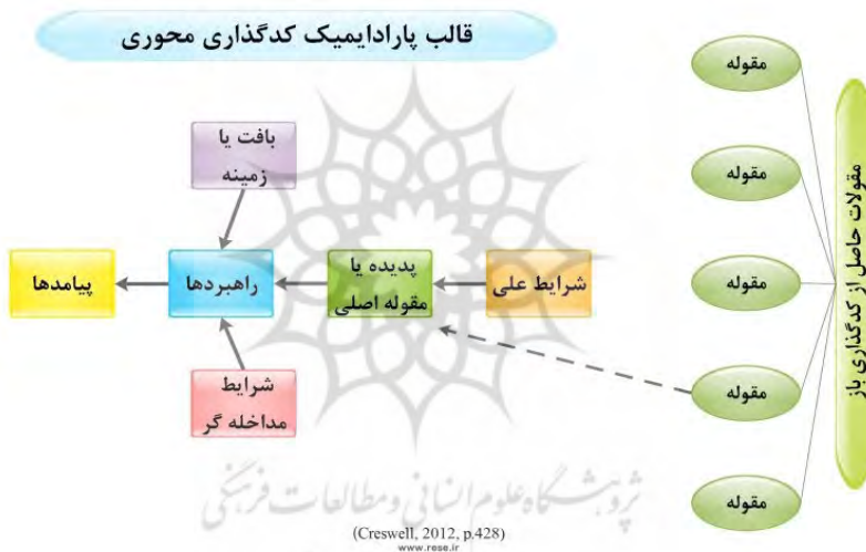
شکل ۲- مدل فرایندی داده بنیاد

ج) گزارش‌های نوشته شده و شفاهی که بسته به نوع مخاطبان و جنبه‌ای از یافته‌ها یا نظریه‌ای که ارائه می‌شود، اشکال مختلفی را در بر می‌گیرد (استراس، کوربین، ۱۳۸۵). محقق نظریه داده بنیاد، از طریق جزء به جزء کردن اطلاعات به شکل بندی مقوله‌ها، اطلاعات مفیدی درباره پدیده مورد مطالعه پیدا کرده و بر اساس داده‌های گرد آوری شده، مقوله‌های اصلی و فرعی را مشخص می‌کند (کرسول، ۲۰۰۵: ۹۷).