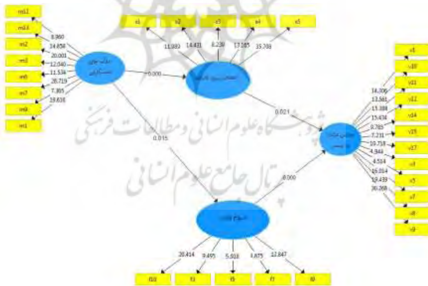
شکل ۳. نتایج سطح معناداری (P-value)