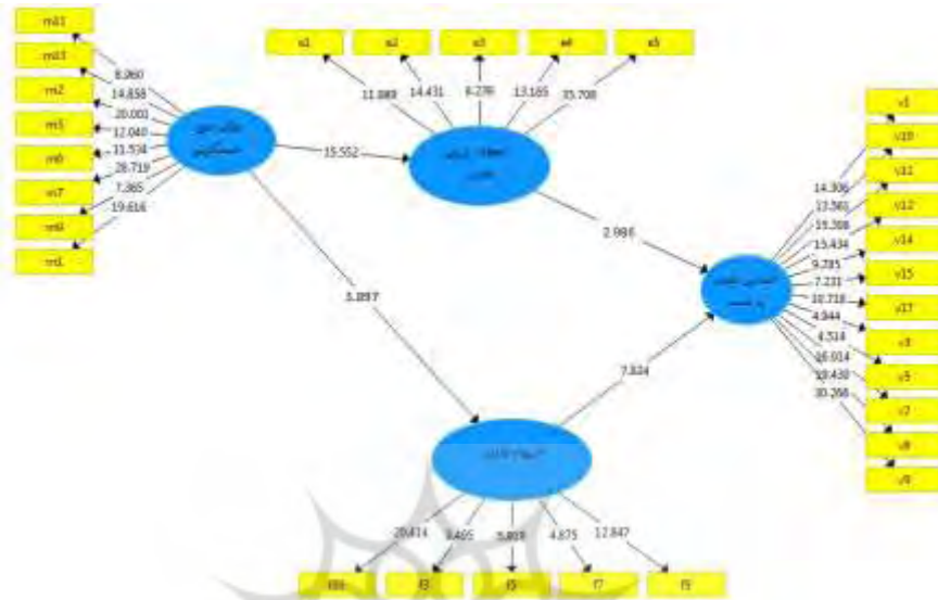
شکل ۲. نتایج آزمون ضرایب معناداری (T-values)