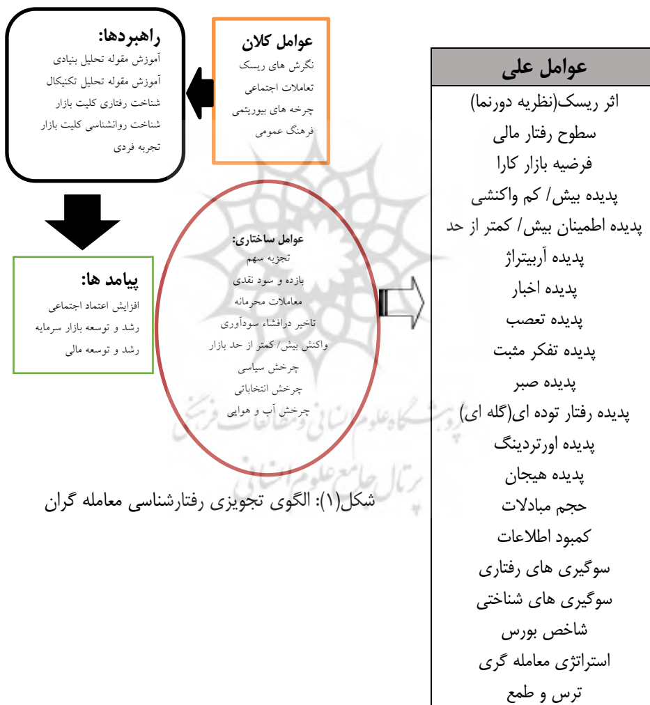
شکل (۱): الگوی تجویزی رفتارشناسی معامله‌گران