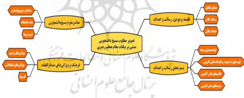
شکل ۳. مؤلفه‌های تصویر مطلوب از تشکل بسیج دانشجویی تراز مبتنی بر بیانات مقام معظم رهبری

از مجموع اسناد موجود از اندیشه مقام معظم رهبری نسبت به بسیج دانشجویی تا به این مرحله از پژوهش می‌توان تصویر مطلوبی از این نهاد انقلابی ترسیم نمود که راهگشای تمام تصمیم‌گیری‌ها، تغییرات و تحولات لازم در آن می‌باشد. این تصویر مطلوب دربردارنده چهار جزء اساسی است که عبارت‌اند از: فلسفه وجودی، رسالت و اهداف، بستر تحقق رسالت و اهداف، فرهنگ و ویژگی‌های متمایزکننده و عناصر مقوم.