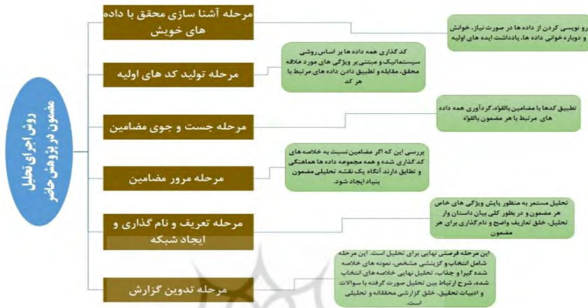
شکل ۲. روش اجرای تحلیل مضمون در پژوهش حاضر

مشترکی که با عنوان مضامین دسته‌بندی شده‌اند در قالب الگویی منسجم به‌عنوان تصویر مطلوب تشکل دانشجویی انقلابی مبتنی بر بیانات مقام معظم رهبری مدظله استخراج و ارائه می‌شوند.