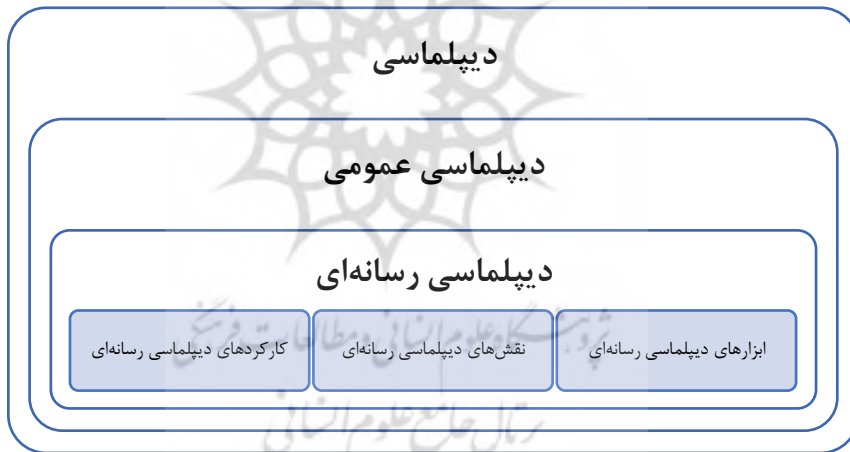
شکل ۱- نمای نظری پژوهش

تلویزیون: تلویزیون از همان آغاز پیدایش، یکی از فعال‌ترین نیروهای قرن بیستم بود و اکنون پرنفوذترین پدیده فرهنگی است (اسمیت و پاترسون، ۱۳۸۱). دستگاه دیپلماسی از ابزار رسانه و به‌ویژه تلویزیون جهانی، برای تأثیرگذاری بر افکار عمومی داخلی و بین‌المللی در خصوص آنچه تصمیمات درست و انسانی در سیاست خارجی نامیده می‌شود، استفاده می‌کند. (دعاگویان، ۱۳۸۸: ۱۲۲). در عصر دیپلماسی رسانه‌های، تلویزیون به‌عنوان ابزار دیپلماتیک، می‌تواند دیپلمات‌ها را در مذاکرات سیاسی و حل‌وفصل منازعات کمک کند، البته در اوضاع کنونی تلویزیون جهانی بیشتر در خدمت منافع سیاسی و اقتصادی برخی کشورهای امپریالیستی قرار دارد و همواره این شبکه‌ها، برنامه‌ها و اخبار جهانی خود را در راستای منافع خودتنظیم و ارائه می‌کنند. (همان: ۸۱).