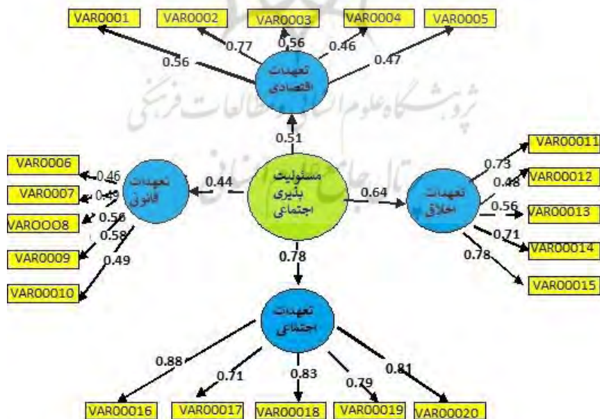
شکل ۱- ارزیابی ابعاد مرتبط با مسئولیت‌پذیری اجتماعی بانوان

در نتیجه، ۴ فرضیه ابتدایی پژوهش تایید می‌شوند؛ چرا که با توجه به بالاتر بودن ضرایب بار عاملی تمامی متغیرها از ۰/۴ نشانگر آن