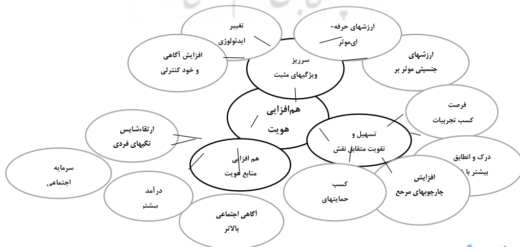
شکل ۱- شبکه مضامین هم‌افزایی هویت جنسیتی و حرفه‌ای زنان شاغل در پست‌های مدیریت

تقویت متقابل خانواده و شغل اشاره دارد که تجربه‌های درون یک نقش، کیفیت زندگی در نقش دیگر را بهبود می‌بخشد به عبارت دیگر تجربه‌های یک نقش تا چه اندازه کیفیت زندگی شامل عملکرد و احساس در نقشی دیگر را تقویت میکند. از نظر گرین هاوس و پاول تقویت متقابل نقشها هنگامی رخ میدهد که منابعی که در نقش الف به دست آمده اند، موجب عملکرد بهتر در نقش ب میشوند. تقویت کردن هنگامی اتفاق می‌افتد که منابع شامل مهارتها و رویکردها، انعطاف پذیری، سرمایه‌های اجتماعی، روانشناختی و فیزیکی و منابع مادی، که از یک نقش به دست می‌آید، موجب بهبود عملکرد نقش دیگر شود. این حالت مسیر ابزاری نامیده میشود [۶]. همچنین ممکن است از طریق مثبت کردن احساس فرد، در نقش ب اثر غیرمستقیم بگذارد که مسیر احساسی نامیده میشود [۱۲]. در مجموع، این مفاهیم به منابع، تجربه‌ها و حالت‌های احساسی و رفتاری که از حوزه خانوادگی به حوزه شغلی یا بالعکس منتقل می‌شوند و فعالیت در حوزه دیگر را بهبود می‌بخشند.