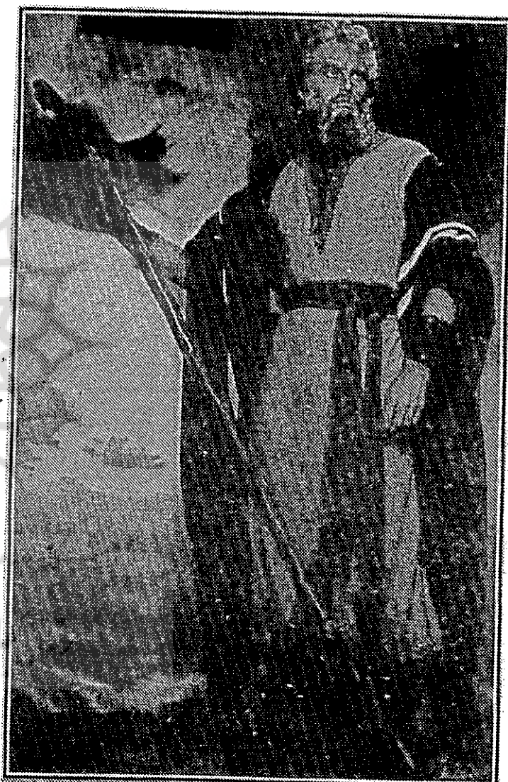
پدر و مادر (فیلم سینمایی بهشت بندگان)

✽ طالبی نژاد: سینما به عنوان پدیده‌ای غربی، هنری است که ریشه در تفکرات برخاسته از تکنولوژی دارد. پس برخلاف هنرهای چون معماری، نقاشی، خط و ... نمی‌توان آن را نهادینه کرد.