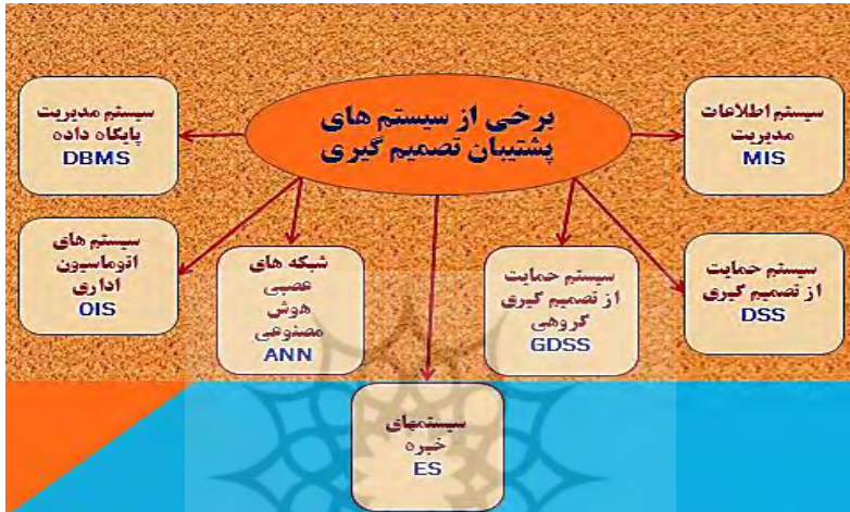
شکل ۱- سیستم‌های پشتیبان تصمیم‌گیری