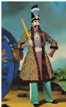
تصویر ۷- پرتره ناصرالدین شاه قاجار، رنگ و روغن روی بوم، اثر هاکوپ هوناتانیان، ۱۴۹×۲۳۶ س.م، بین سال ۱۸۶۰ تا ۱۸۷۰، موزه تاریخ هنر وین، اتریش. مأخذ: (یحیی ذکا، ۱۳۷۸)