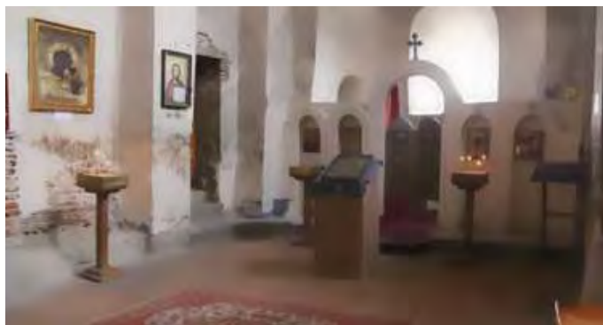
تصویر ۶- فضای داخلی کلیسای ایلستیکه، قرن چهارم میلادی، گرجستان.

۱. ورودی کلیسا؛ که دارای مقامی روحانی است و به مفهوم حرکت