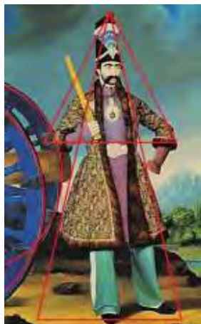
تصویر ۸- آنالیز هندسی از ترکیب‌بندی پرتره ناصرالدین شاه قاجار.