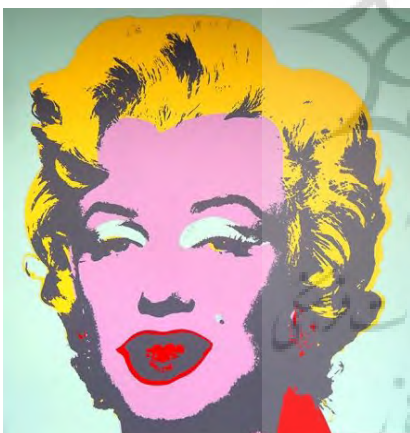
تصویر ۲- اندی وار هول: از مجموعه چاپ‌های رنگی چهره مرلین مونرو، ۱۹۶۷؛ (James, 1996, 99) مأخذ.

اختصار فرآیند تمایزات شخصی وابسته به تکنیک دست هنرمند را تا حد زیادی به نفع تصاویری سراسر و یکسان کاهش می‌دهد. به عبارت دقیق‌تر، نمود فردیت هنرمند (همان سوژه‌ی نابغه در زیبایی‌شناسی کانت) در اثر بسیار کم شده و بر این اساس هویت شخصی در پیامی عمومی