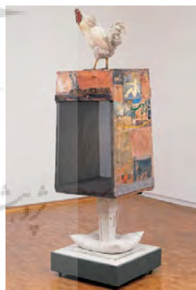
تصویر ۱- رابرت راشنبرگ: اودالیسک؛ ترکیب مواد، ۱۹۵۵-۵۸. (James, 1996, 43) مأخذ.