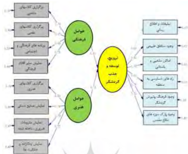
نمودار ۲- مدل در حالت تخمین استاندارد