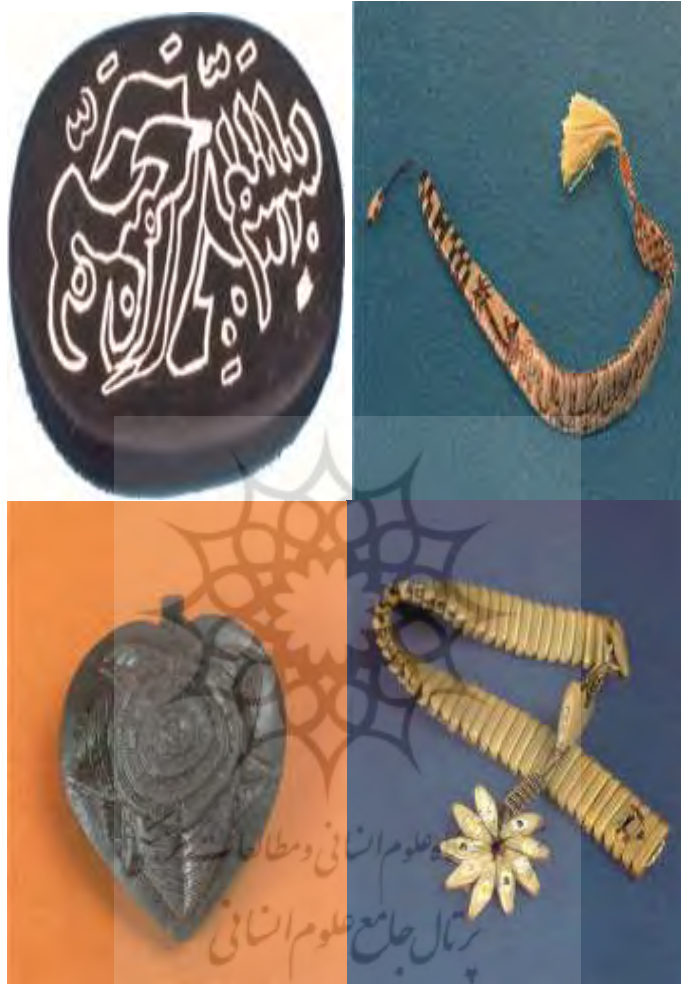
ساخت انواع تسبیح و سنگ

ضمیمه: برخی از آثار هنری تولید شده توسط اسرای جنگی ایران در عراق