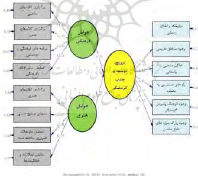
نمودار ۳- مدل در حالت ضرایب معناداری