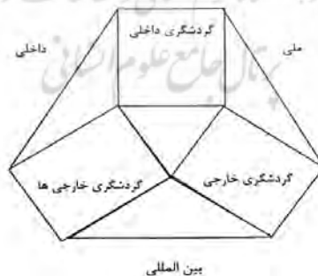
نمودار ۴: اشکال جهانگردی

اشکال متفاوتی از سفر وجود دارد که به شخص مسافر، انگیزه و مقصد انتخابی وی بستگی دارد. مسافرت‌ها را به خارجی (بین المللی) و داخلی، درون منطقه‌ای و برون منطقه‌ای و درون مرزی و برون مرزی تقسیم می‌کند.