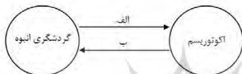
شکل (۱): روابط تعاملی سودمند میان اکوتوریسم و گردشگری انبوه

رایج و متعارف انبوه راهکارهایی معرفی شود؛ زیرا این چیزی است که در دنیای واقعی امروز اتفاق افتاده و نیازمند توجه است (لیو، ۲۰۰۳: ۴۷۲) و رویکردی عمل‌گرا را می‌طلبد. در همین باره، ویور ۱ (۲۰۰۱) با نگاهی پراگماتیک مفهوم اکوتوریسم انبوه را معرفی کرده و معتقد است می‌توان با بهره‌گیری از منافع هر یک اکوتوریسم انبوه را به نحوی مطلوب توسعه داد (شکل شماره ۱) گردشگری انبوه برای اکوتوریسم منافی در پی دارد، از جمله فراهم‌آوردن انبوهی از مشتریان و درآمد، ایجاد صرفه‌های مقیاس سازگار با مفهوم پایداری و افزایش قدرت چانه‌زنی و توان رقابت با سایر فعالیت‌های اقتصادی در به‌دست‌آوردن منابع محدود. اکوتوریسم نیز می‌تواند برای گردشگری انبوه منافی داشته باشد، مانند متنوع‌سازی محصول گردشگری انبوه، جذابیت برای بازار روبه رشد گردشگری انبوه سبز و تبلیغ برای اصول پایداری. بدین ترتیب با فراهم‌آوردن شرایطی برای توسعه‌ی اکوتوریسم انبوه علاوه بر پاسخ به نیاز بازار می‌توان از منافع هر دو نیز بهره برد و پایداری را در عمل محقق ساخت. توجه به رقابت و نیاز بازار از جمله موضوعاتی است که در پراگماتیسم مطرح است.