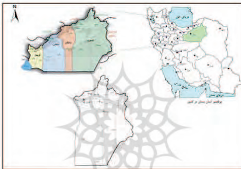
نقشه شماره ۱- موقعیت استان سمنان در کشور و شهرستان شاهرود در استان

استان ملاحظه می گردد. در این طرح سعی بر این است که با بررسی سوانح جاده‌ای استان، نقش و سهم عوامل موثر در بروز تصادفات واژگونی مشخص و نقاط حادثه خیز تعیین تا با ارائه راهکارهای اصلاحی و اقدامات پیشگیرانه از وقوع این حوادث جلوگیری یا آن را به حداقل رساند.