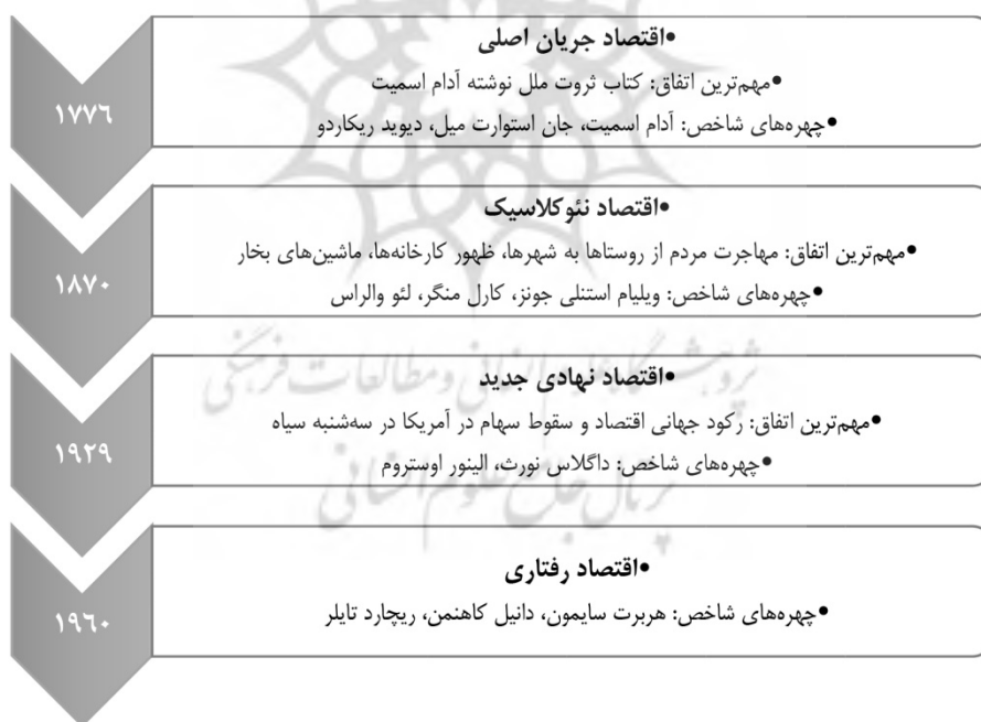
شکل ۱. سیر تحول مکاتب اقتصادی در طول تاریخ

افراد در عمل، به دلیل محدودیت دانش خود، در انتخاب‌هایشان به تصمیم‌گیری‌های رضایت‌بخش بسنده می‌کنند. همچنین اقتصاددانان رفتاری، مفروضات نئوکلاسیک‌ها را درباره پایداری و سازگاری ترجیحات و اولویت‌های فردی و استقلال آن‌ها از متغیرهای محیطی، از جمله اجتماع و رسانه‌ها و... مورد نقد قرار دادند (هاوسمن و مک پیرسون، ۲۰۰۶؛ انگلن، ۲۰۰۵؛ الستر، ۲۰۰۹). باور آن‌ها چنین است که ترجیحات افراد در طول زمان تغییر می‌کند و سلیقه افراد تحت شرایط و عوامل گوناگون متفاوت و گاه متضاد است. از این رو، تبیین چگونگی شکل‌گیری اولویت‌های تصمیم‌گیری افراد به اقتصاددانان کمک می‌کند که از عوامل تعیین‌کننده اولویت‌های فردی درک درستی را به دست آورند (آلتمن، ۱۳۹۷). هرچند اقتصاد رفتاری نقدهای زیادی بر اقتصاد نئوکلاسیک دارد؛ اما به‌طور کامل دستاوردهای آن را کنار نگذاشته است. تمرکز اقتصاد رفتاری بر ساختن یک علم اقتصاد کاربردی، دقیق و واقع‌گرایانه‌تر بر پایه همان پیش‌فرض‌های اقتصاد نئوکلاسیک است (کامرر، لونسیتین و رایبن، ۲۰۰۴؛ هو و کامرر، ۲۰۰۶) (شکل ۱).