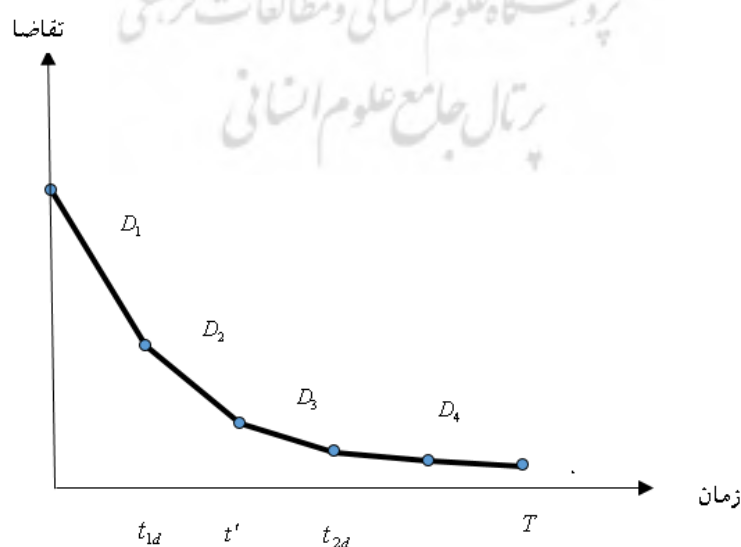
شکل ۱- نمودار تقاضا بر حسب زمان

نمودار تقاضا بر حسب زمان به صورت زیر است: