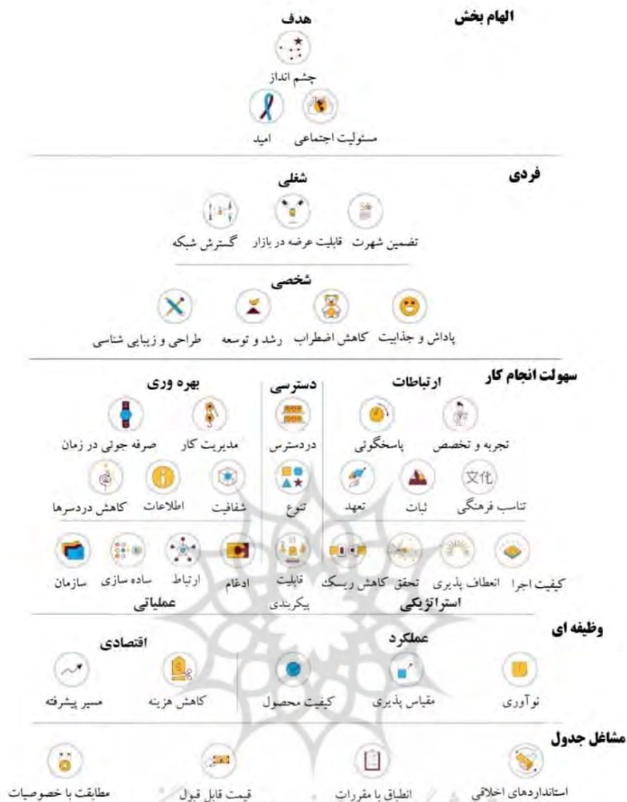
شکل ۱: هرم ارزش (آلم کریست و همکاران، ۲۰۱۸)

انتخاب و در نهایت در تحلیل عاملی اکتشافی ۲۷۰ پرسشنامه کامل جمع آوری شد. در مرحله تحلیل عاملی تأییدی نیز ۲۶۵ نمونه از ۳۰۰ نمونه دیگر از این جامعه آماری جمع آوری شد.