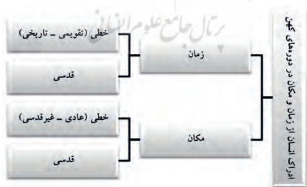
شکل ۱- ادراک انسان از زمان و مکان در دوره‌های کهن

طبق نظرات الیاده، انسان دوره‌های کهن، زمان و مکان را به گونه‌ای ویژه درک می‌کرد و این شیوه ادراک در جلوه‌های مختلف جهان‌بینی او قابل ردیابی است؛ به باور الیاده «تجربه یا ادراک زمان نزد اقوام ابتدایی همواره با تجربه و ادراک زمان نزد انسان غربی جدید برابر نیست. [...] تجربه و ادراک زمان (دنیوی)، نزد مردم ابتدایی، همواره مدخلی پایدار بر زمان مذهبی می‌گشاید» (الیاده، ۱۳۹۴: ۳۶۵)؛ البته این شیوه نگاه به زمان و مکان، هنوز در لایه‌های ژرف ضمیرناخودآگاه جمعی او پابرجاست و یک تصویر، نماد یا روایت کهن‌الگویی می‌تواند آن را برانگیزاند.