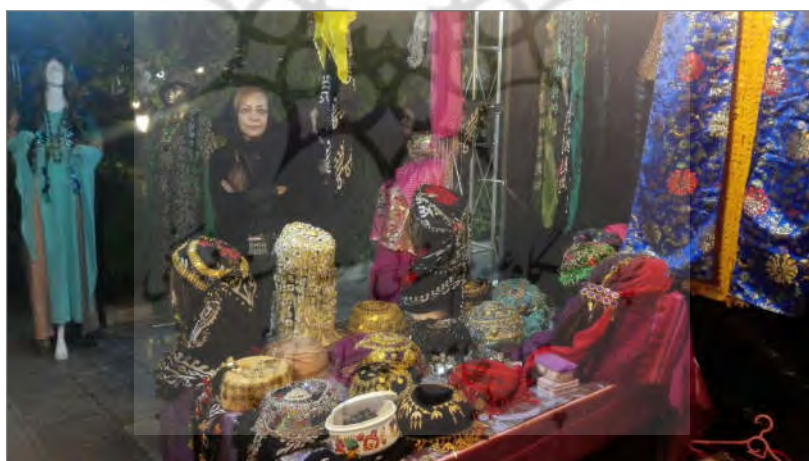
کلاه‌دوزی «پنجمین نمایشگاه تخصصی صنایع دستی سنندج»، سنندج، عمارت تاریخی آصف، ۱۳۹۶/۷/۲۵