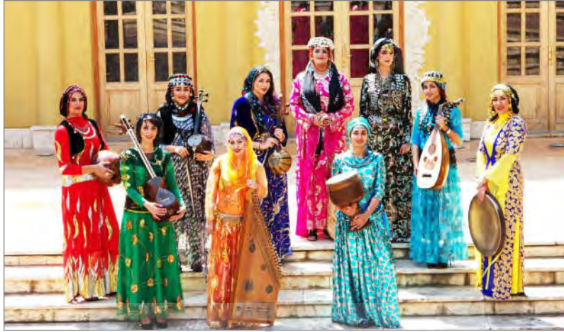
نمونه‌ای از کلاوقس