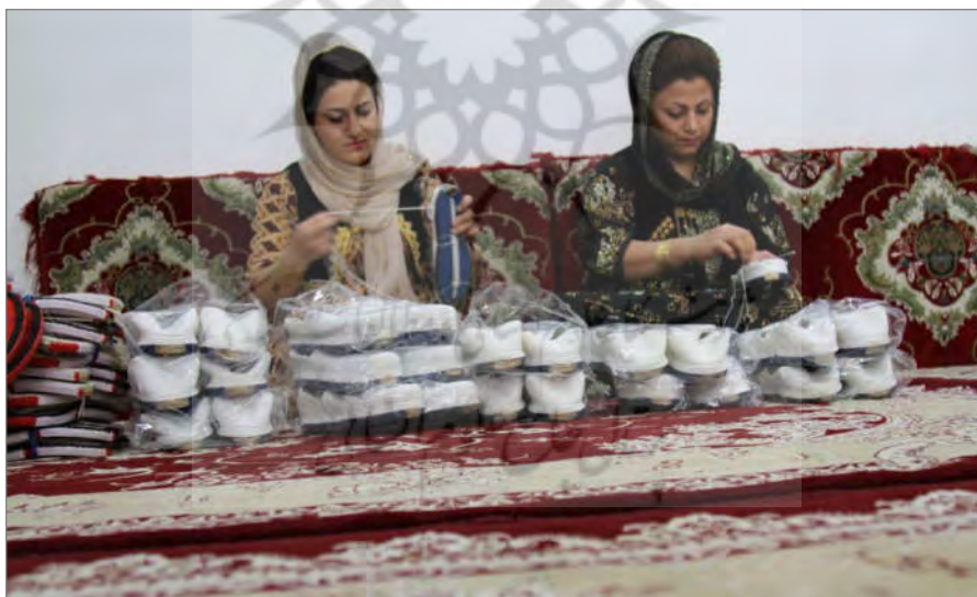
گیوه‌بافی زنان سنندجی