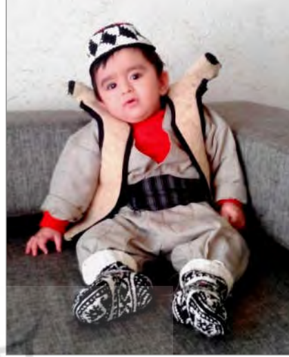
نوعی فرنجی که در شهر و روستا مورد استفاده قرار می‌گیرد.