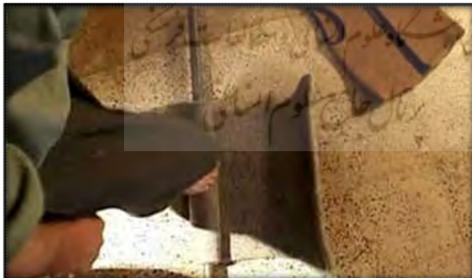
مراحل ساخت فرنجی