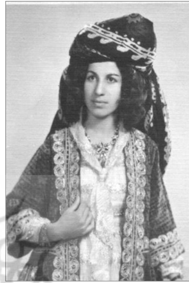
نمونه‌ای از شلیته قیطان دوزی دهه ۳۰