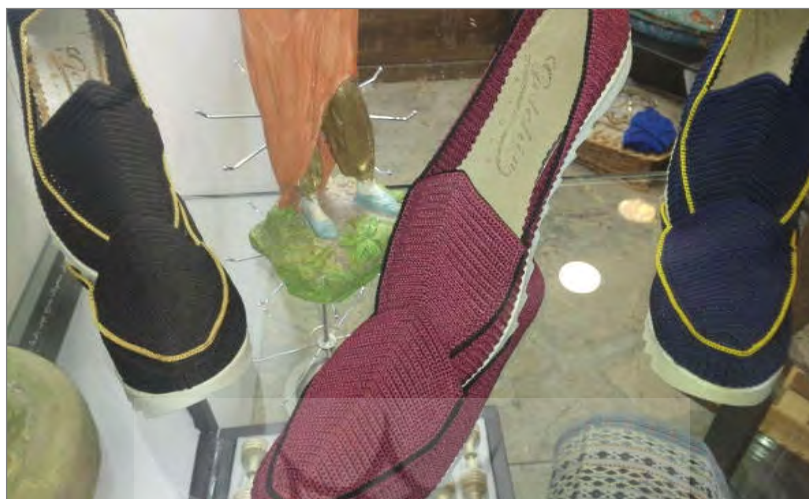
نمونه‌هایی از کلاش‌بافی عکس و کار توسط: ناهید روزنیک