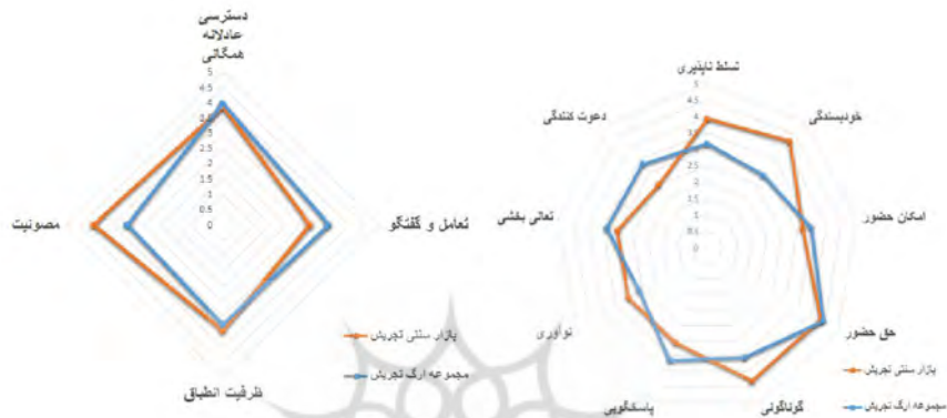
تصویر (۳)-مقایسه عامل‌های چهارگانه عمومیت فضا و ابعاد مختلف آنها در دو فضای مورد مطالعه

پس از تحلیل داده‌های گردآوری شده از طریق پیمایش و مشاهده، امتیازهای چهارگانه و ابعاد مختلف آنها محاسبه گردید که در تصویر (۳) در غالب نمودار قابل مشاهده می‌باشند.