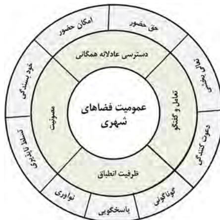
تصویر (۱) - انگاره‌های سازنده عمومیت فضاهای شهری برپایه بررسی قابلیت کاربست عامل‌های سازنده عمومیت در گفتمان جامعه مدنی

در مورد عامل تنوع، ویژگی ظرفیت انطباق پیشنهاد می‌گردد. میزان پاسخگویی فضا به نیازهای افراد، گوناگونی اقشار حاضر در فضا، و امکان تحقق فعالیت‌های جدید از طریق توانمندی فضا در پاسخ به نیازهای نوآورانه و فعالیت‌های خود جوش‌حاضرین، سه بعد این عامل هستند، که به ترتیب پاسخگویی، گوناگونی و نوآوری نام گذاری شده‌اند. در مورد عامل تعامل اجتماعی و گفتگو، چنان که شرح داده شد دلیل اصلی حضور این عامل در میان عامل‌های سازنده عمومیت فضاها در گفتمان جامعه مدنی، حاصل پیوند این عامل و عامل امر عمومی است. ولی در مورد فضاهای شهری موضوع گفتگوها اهمیت چندانی در تعیین میزان عمومیت ندارد و خود تعامل و گفتگو و کیفیت تعاملات اجتماعی هدف غایی فضای عمومی و یکی از عامل‌های سازنده عمومیت فضا است. به همین دلیل بر اساس نتایج روش دلفی دو بعد دعوت‌کنندگی فضا برای تعامل، و تعالی بخشی به کیفیت این تعاملات شامل میزان تکرار، مدت و عمق ارتباطات برای آن در نظر گرفته شده است.