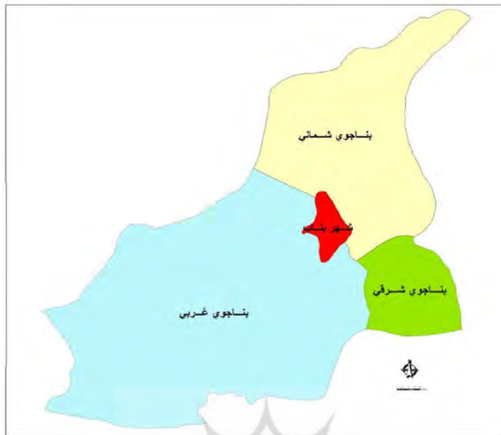
نقشه شماره ۲: موقعیت شهر بناب و دهستانهای بناب

منبع: اخذ از طرح جامع شهر بناب، مهندسین مشاور نقش محیط توسط نگارندگان ۱۳۹۶