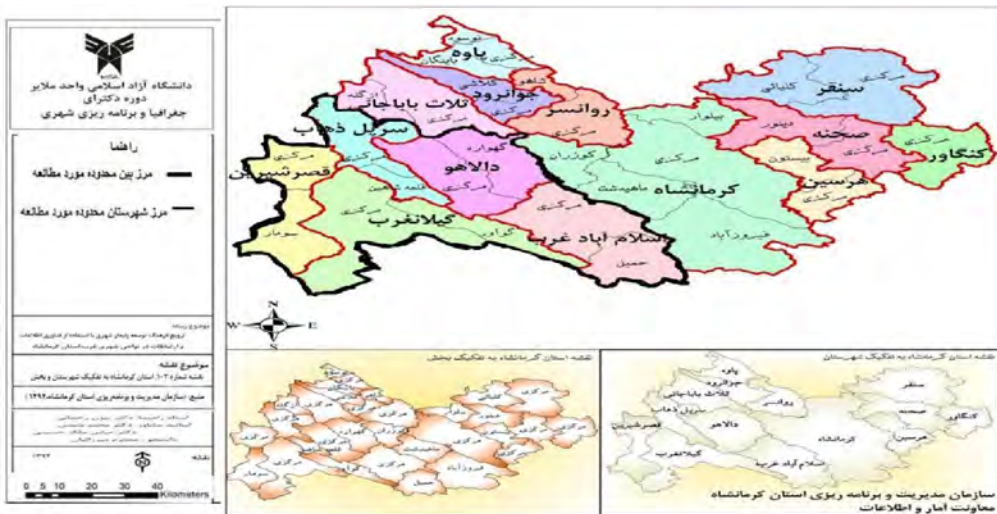
شکل شماره ۳. نقشه محدوده مورد مطالعه

برای محاسبه نمونه از فرمول کوکران با خطای استاندارد ۵ درصد و سطح اطمینان ۹۵ درصد استفاده شده است. حجم نمونه ۳۲۳ نفر برآورد گردید که برای روایی بیشتر به ۳۸۶ پرسشنامه افزایش یافت.