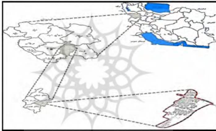
شکل ۱. موقعیت جغرافیایی منطقه مورد مطالعه

استان کردستان با مساحت ۲۸،۲۰۳ کیلومتر در غرب ایران مجاور کشور عراق بین ۳۴ درجه و ۴۴ دقیقه تا ۳۶ درجه و ۳۰ دقیقه عرض شمالی و ۴۵ درجه و ۳۱ دقیقه تا ۴۸ درجه و ۱۶ دقیقه طول شرقی از نصف النهار گرینویچ قرار دارد که این مساحت ۱۰۷ درصد از مساحت کل کشور را شامل می‌شود و از نظر وسعت رتبه ۱۶ را در کشور دارا است. و از شمال به استانهای آذربایجان غربی و قسمتی از زنجان و از جنوب به استان کرمانشاه و از شرق به استان همدان و قسمتی دیگر از استان زنجان و از غرب به کشور عراق محدود می‌باشد، منطقه مورد مطالعه شهرستان دهگلان در استان کردستان با مساحت کلی ۲۰۵۰ در بین ۳۵ درجه و ۱ دقیقه تا ۳۵ درجه و ۳۹ دقیقه عرض شمالی نسبت به خط استوا و ۴۷ درجه و ۷ دقیقه تا ۴۷ درجه ۳۶ دقیقه طول شرقی نسبت به نصف النهار گرینویچ و در ارتفاع ۱۸۲۰ متری از سطح دریا قرار گرفته است.