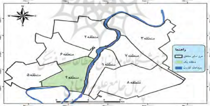
شکل ۱. موقعیت منطقه‌ی ۴ کلان‌شهر اهواز

منطقه‌ی ۴ کلان‌شهر اهواز از غرب به مسیر پل ششم حد فاصل رودخانه کارون تا بلوار ساحلی، خیابان شهید بهشتی حد فاصل بلوار گلستان تا راه‌آهن از شمال بلوار گلستان مسیر پل ششم تا خیابان شهید بهشتی، راه‌آهن حد فاصل خیابان شهید بهشتی تا خیابان تخت سلیمان، خیابان تخت سلیمان حد فاصل راه‌آهن تا رودخانه شرق رودخانه کارون حد فاصل خیابان تخت سلیمان تا محدوده شهر جنوب محدوده شهر حد فاصل رودخانه کارون تا بلوار شهرک پیام محدود می‌شود (شکل ۱). مساحت محله‌ی نهضت‌آباد، ۵۲۰۰۰۰ مترمربع است. بر اساس سرشماری سال ۹۰ مرکز آمار ایران، جمعیت محله‌ی نهضت‌آباد ۶۳۰۴ نفر و تعداد خانوارهای این محله ۱۷۲۲ خانوار است (شکل ۲). محدوده نهضت‌آباد یکی از قدیمی‌ترین محله‌های کلان‌شهر اهواز بوده و روابط بین ساکنین آن متأثر از قدمت و همچنین روابط خویشاوندی و فامیلی می‌باشد (شهرداری اهواز، ۱۳۹۶).