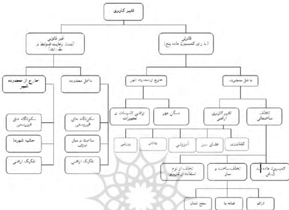
شکل ۲: بررسی انواع تغییر کاربری اراضی در سطح شهرهای ایران